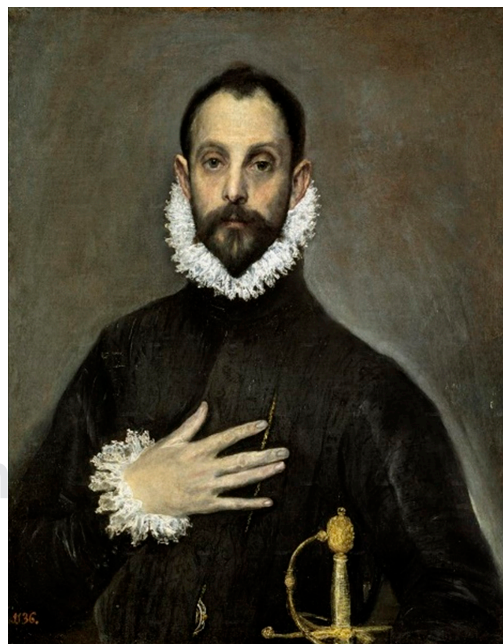
Figura 1: Obra del Greco, intitulada El caballero de la mano en el pecho .

De acuerdo con los expertos, lo que convierte al retrato en obra maestra es la gravedad y sobriedad de esta persona, mostrando el prototipo del caballero cristiano, captado en el momento de realizar un juramento con la mano sobre el pecho y con la espada para defender el cristianismo. Los rasgos físicos, la actitud y el atuendo corresponden a un aristócrata, su atuendo sobrio es conforme a la moda de la corte de la época, los signos de su posición social son: