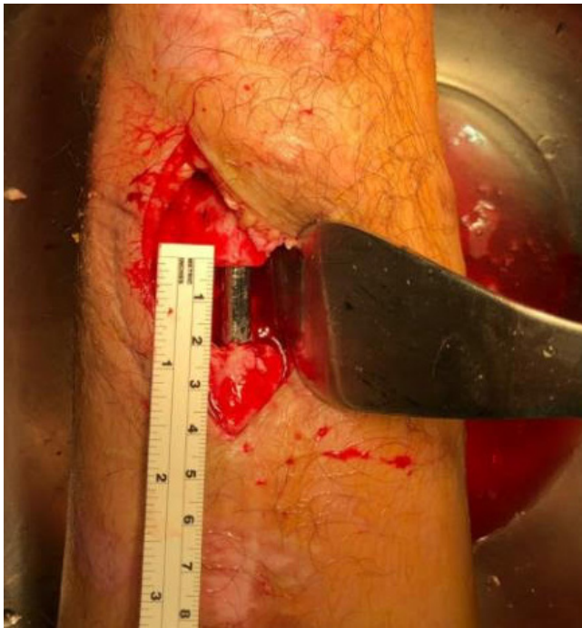
Figura 2: Foto transquirúrgica en la que se observa defecto óseo de 2 cm.

vascularizado, muchos autores reservan esta operación para las extremidades torácicas, sobre todo en radio y cúbito teniendo altos porcentajes de fractura vistos en tibia proximal, además de ser una práctica más costosa y más exigente en cuanto al desarrollo de la misma, requiriendo equipo especializado y personal familiarizado con la microcirugía; por otro lado, la colocación de injerto autólogo rinde buenos frutos en miembros pélvicos, sin embargo, ante la lesión de circulación endóstica y perióstica que conlleva la osteomielitis crónica, no se recomienda su uso si el sitio de recepción no cuenta con adecuada irrigación del área siendo frecuentes las infecciones ante estos escenarios. 7,8