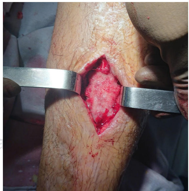
Figura 3: Foto transquirúrgica posterior a colocación de cemento en defecto óseo.

El primer grupo, en el cual se utilizó el clavo, tuvo un acortamiento en el tiempo procurando permitir al paciente la descarga (2.4 versus 4.6 meses), en comparación con el otro grupo, en donde se utilizó la placa y se logró una disminución en el riesgo de reoperación (17 versus 46%), por lo que se indica que, siempre y cuando sea viable, la utilización de fijación interna con clavo centromedular en la propuesta de Masquelet, en tibia y fémur, se prefiera este tipo de implante frente a la estabilización con placa. 10