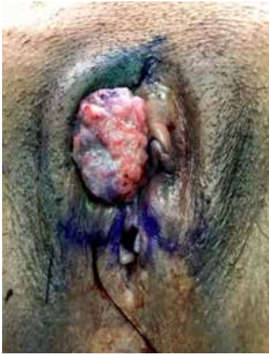
Figura 1: Tumor ulcerado e infiltrante en el labio mayor derecho, clínicamente es evidente el espesor tumoral mayor de 1 mm.

Imagen en color en: www.medigraphic.com/actamedica