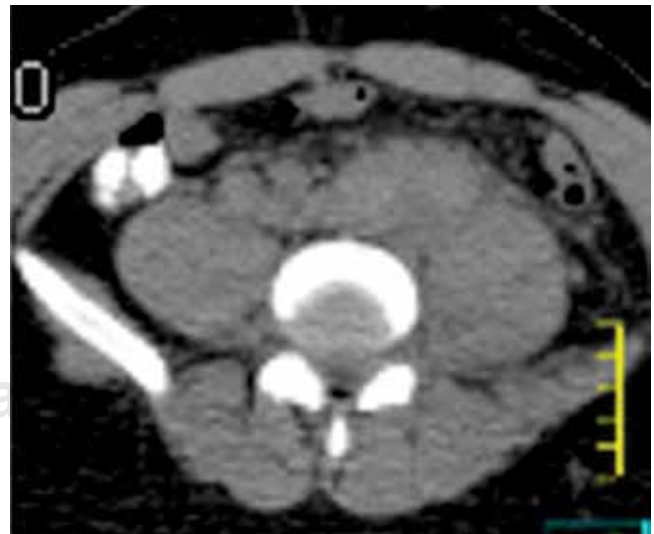
Figura 1: Tomografía computada abdominal, fase simple, corte axial; muestra adenopatías que envuelven a la vena cava e iliacas primitivas.

El hemangioma se trata de una enfermedad rara de curso generalmente benigno; en la mayoría de los casos desaparece antes de la adolescencia; su presentación es más