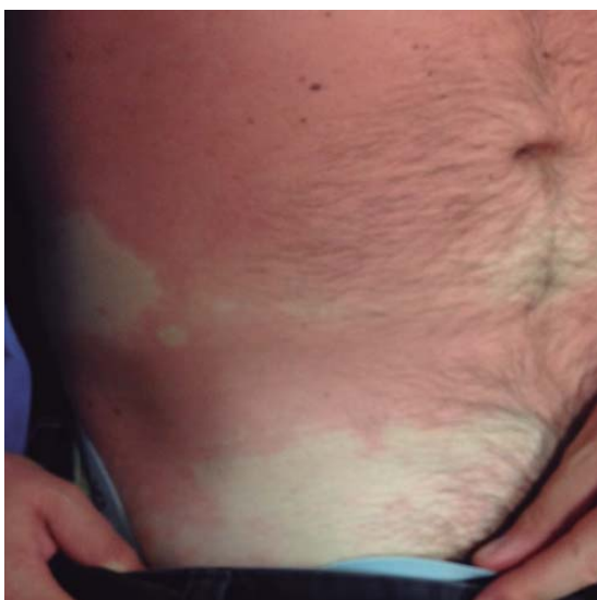
Figura 2. Eritema bien definido con islas de piel respetadas.

Imagen en color en: www.medigraphic.com/lactamedica