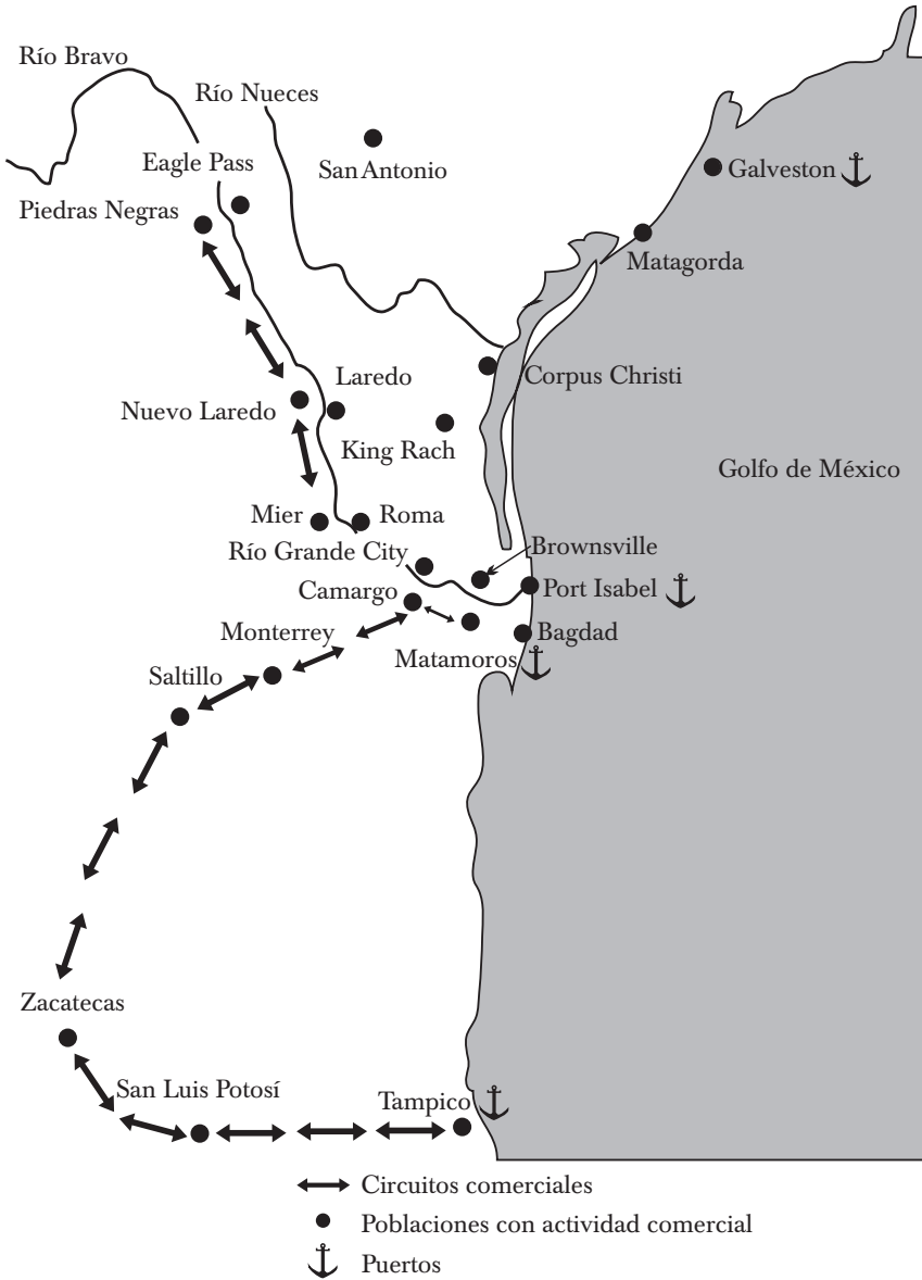
MAPA 1. LOS CIRCUITOS MERCANTILES DESDE MATAMOROS