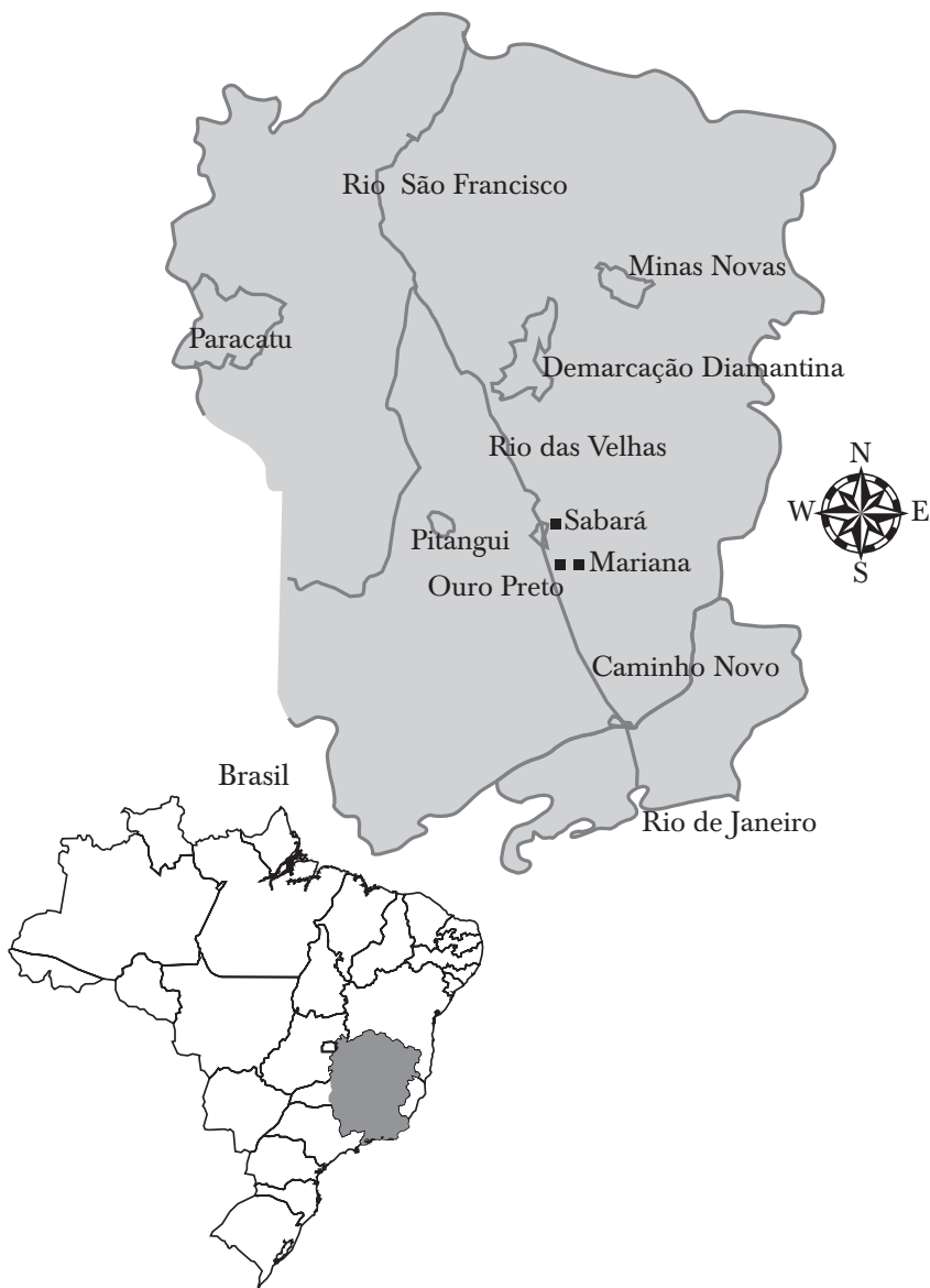
MAPA 1. CAPITANIA DE MINAS