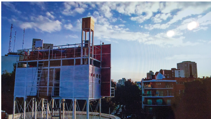
3a) #ScribeBillboard , Ciudad de México, 2013. Vista posterior de la casa-espectacular.; b) #ScribeBillboard , Ciudad de México, 2013. Vista exterior durante el proceso de realización de la pintura de Cecilia Beaven.