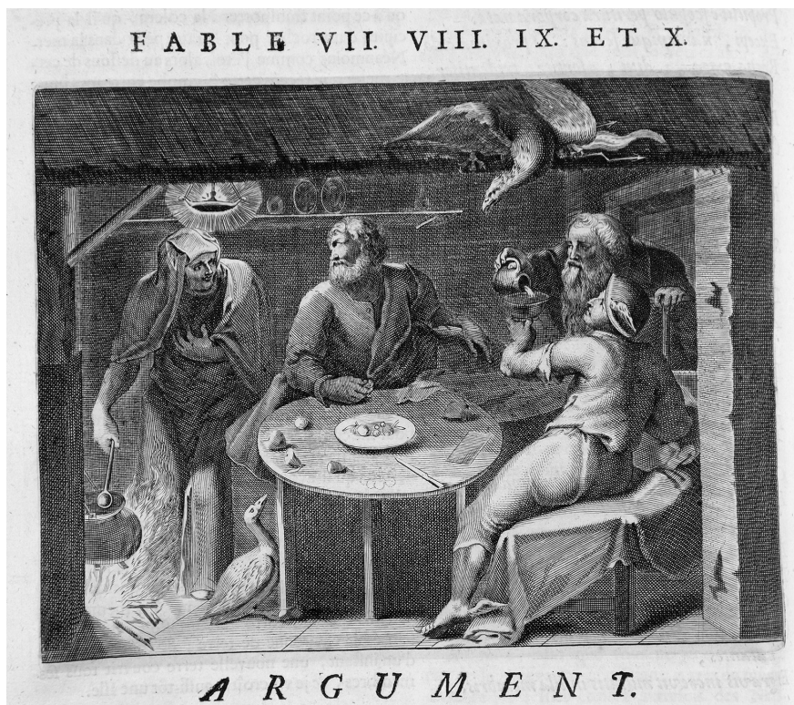
6. Otto van Veen, Filemón y Baucis , tomada de Quinti Horatii Flacci Emblemata (Amberes: Ex Officina Hieronymi Verdussen, 1607), placa 87.

en 1200, “Apenas ahora, en el curso de la recepción general de la ciencia natural aristotélica, las teorías alquímicas alcanzan un efecto más amplio en el marco de las instituciones universitarias” (“Erst jetzt, im Zuge der Gesamtrezeption der aristotelischen Naturwissenschaft, erlangen die alchemistischen Theorien im Rahmen der universitären Institution eine breitere Wirkung”), en Obrist, “Die Alchemy”, 40. Sobre los tratados de Avicenna, véase Dimitri Gutas, Avicenna and the Aristotelian Tradition: Introduction to Reading Avicenna’s Philosophical Works (Leiden: Brill, 2014); Avicenna, The Metaphysics of the Healing: a Parallel English-Arabic Text = al-Shifā’ al-Ilahiyāt , trad. Michael E. Marmura (Utah: Brigham Young University Press, 2005); Avicenna, Liber primus naturalium. Tractatus secundus de motu et de consimilibus , eds. A. Allard, J. Janssens y S. van Riet (Bruselas: Académie Royale de Belgique, 2006).