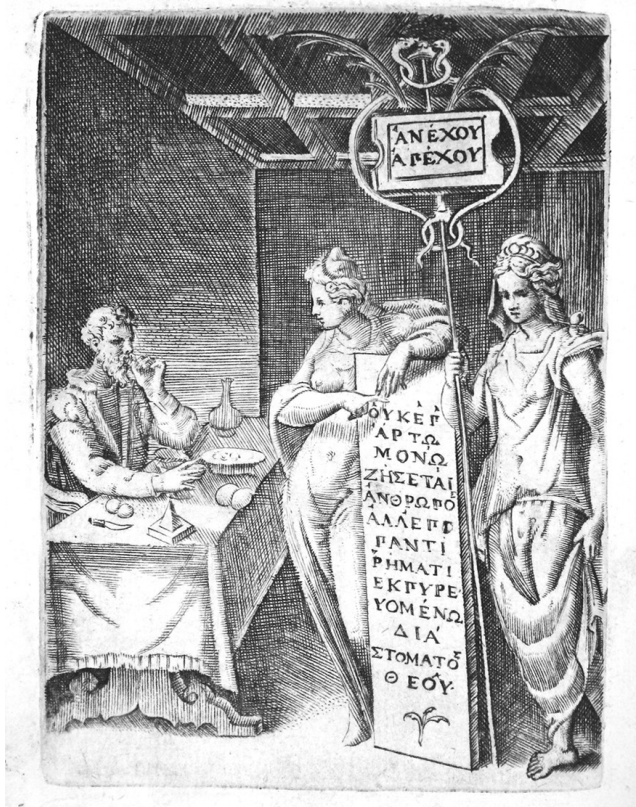
5. Giulio Bonasone, Symbolon XXVII: Pabula læta animi hæc ne sperne, beaberis ultro , Boloña, 1574, grabado tomado de Achille Bocchi, Symbolicarum quaestionum, de universo genere, quas serio ludebat, libri quinque , lib. I (Boloña: Apud Societatem Typographiae Bononiensis, 1574), 58.

LVIII LIB. I. PABVLA LETA ANIMI HÆC NE SPERNE, BEABERIS VLTRO. HOC ILLVD BOCCHI NOBILE SYMPOSIVM EST. Symb. XXVII.