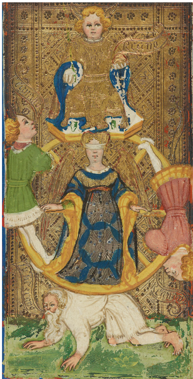
7. Bonifacio Bembo, La rueda de la fortuna , Italia, ca. 1442–1445, miniatura con taroccato, cartas del Tarot Visconti. The Morgan Library & Museum, Nueva York, MS M.630.9).