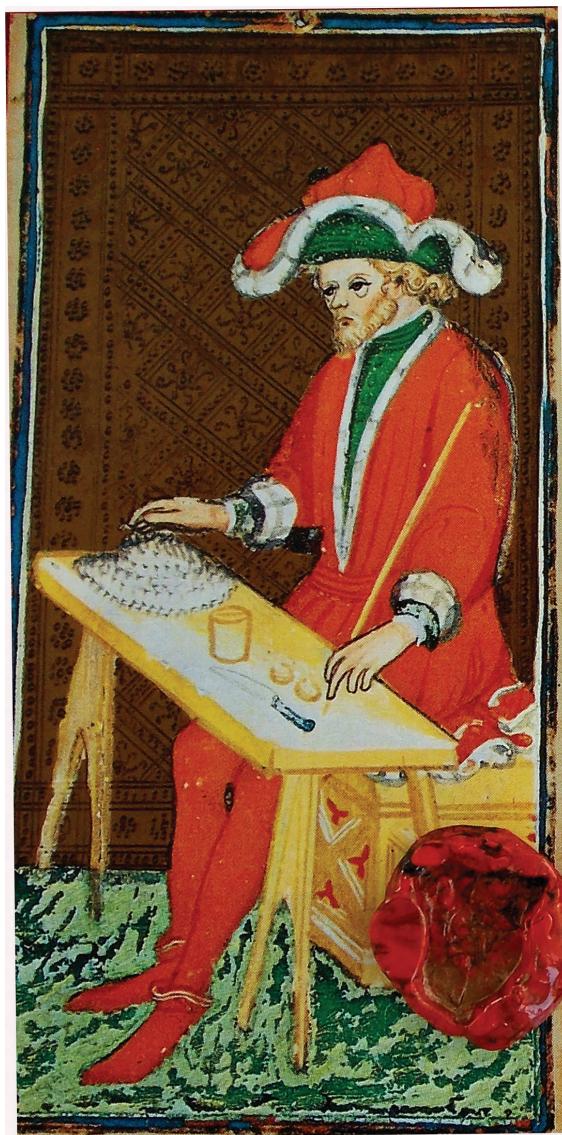
1. Bonifacio Bembo, El Mago del tarot Visconti , Italia, ca. 1447-1477, miniatura con taroccato . Visconti-Sforza Tarot Cards. The Morgan Library and Museum, MS M.630.1.