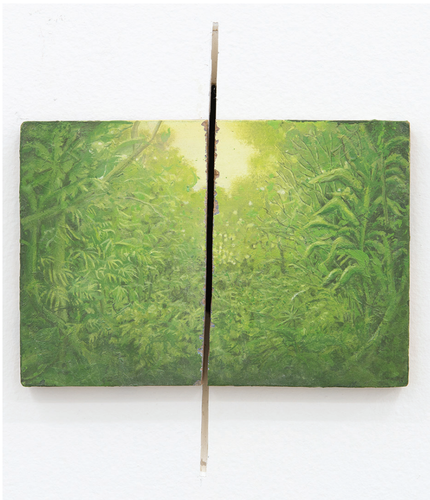
1. Francis Alÿs, fragmento de The Cut , 1993-2015, acción, óleo sobre tela y video. Cortesía de Francis Alÿs.

es si la exposición de Alÿs puede considerarse un epítome del papel de la pintura en el arte contemporáneo y cómo funcionaría.