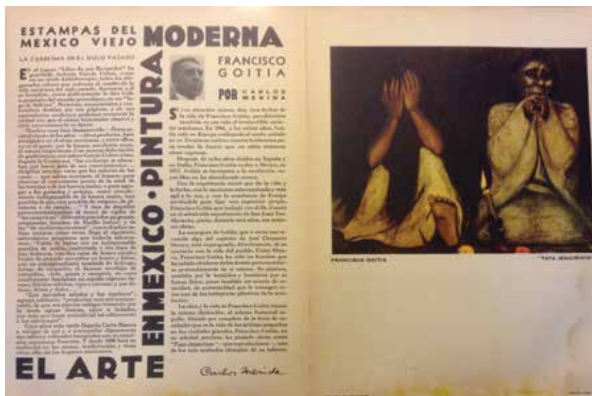
12. Páginas interiores del Boletín Mensual Carta Blanca , mayo de 1937. Colección particular.