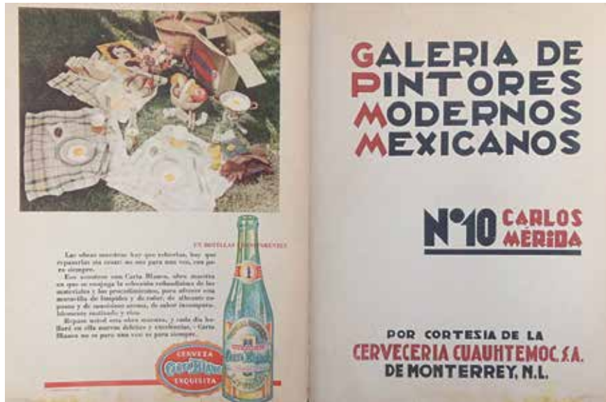
1. Contraportada y portada de Galería de Pintores Modernos Mexicanos , ca. 1934. Colección particular.