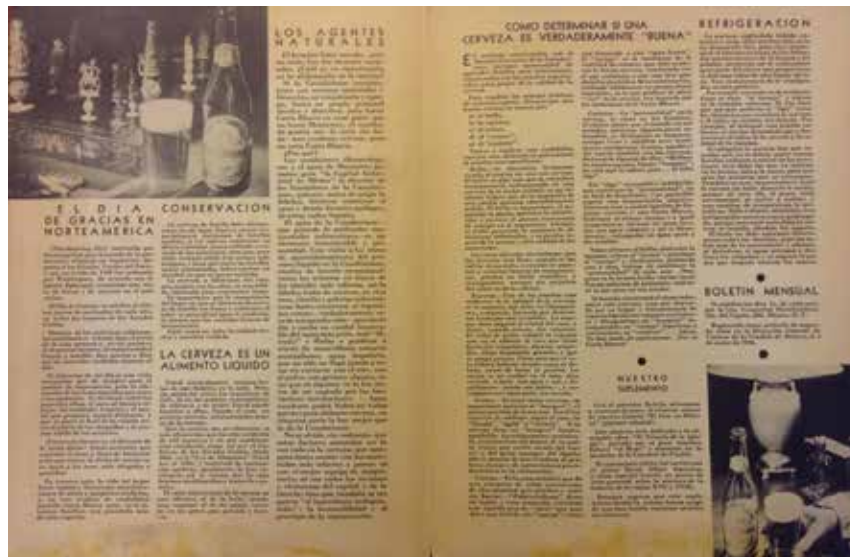
4. Reverso de la portada y contraportada del Boletín Mensual Carta Blanca , noviembre de 1935. Colección particular.