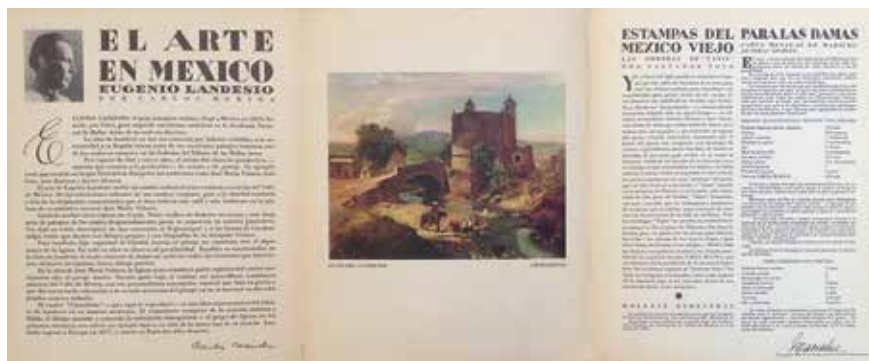
14. Páginas interiores del Boletín de Arte Carta Blanca , agosto-septiembre de 1938. Colección particular.

como un formato divulgativo asociado abiertamente a una agencia publicitaria. Las notas sobre arte que incluía no pretendían ser exhaustivas ni presentar reflexiones teóricas profundas, sino ser breves ensayos dedicados a promover la difusión del arte entre la población de cierto nivel sociocultural. Por ello, varios de los ejemplos transcritos parecieran ser más una reseña histórico-biográfica de los autores que el análisis de una obra específica. Si bien la presencia de la nota sobre arte y su correspondiente ilustración siempre ocupó el lugar central del Boletín , casi siempre iban acompañadas de otras notas diversas sobre múltiples temas de cultura general. Se trataba de pequeños artículos