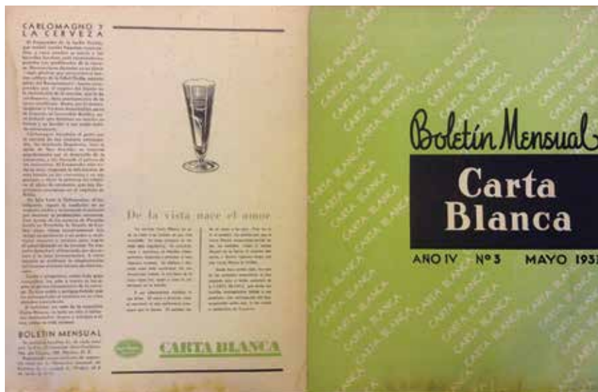
11. Contraportada y portada del Boletín Mensual Carta Blanca , mayo de 1937. Colección particular.