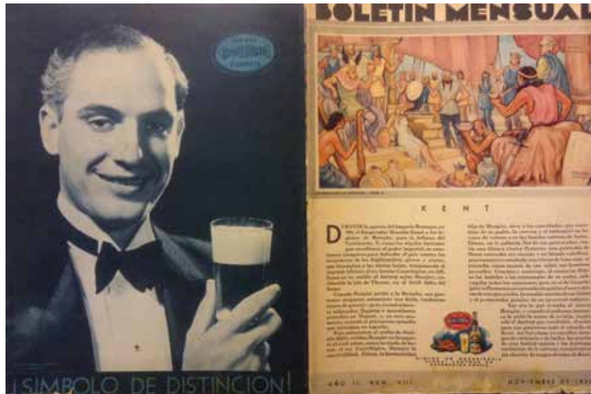
3. Contraportada y portada del Boletín Mensual Carta Blanca , noviembre de 1935. Colección particular.