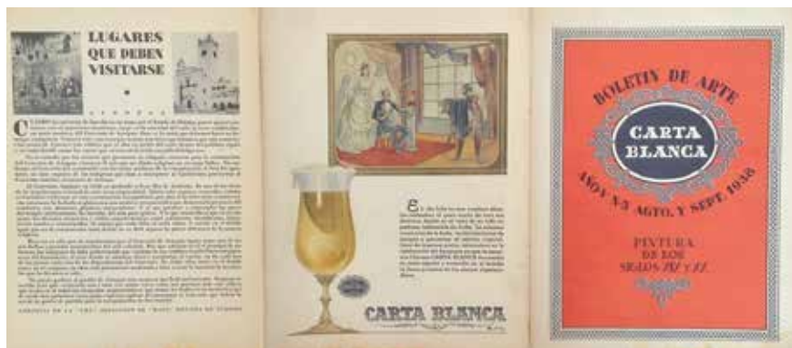
13. Contraportada, página central y portada del Boletín de Arte Carta Blanca , agosto-septiembre de 1938. Colección particular.