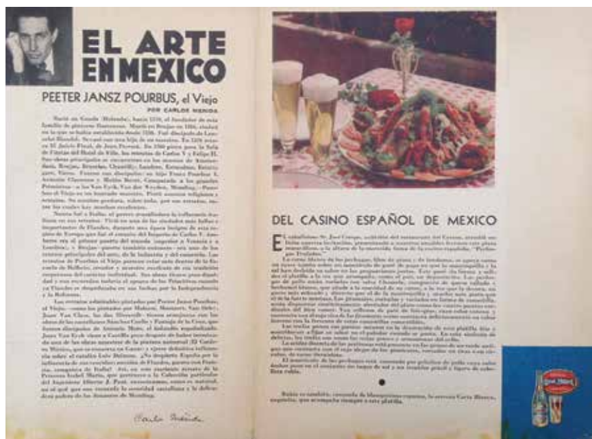
9. Páginas interiores del Boletín Mensual Carta Blanca , marzo de 1936. Colección particular. Fotografía del autor.