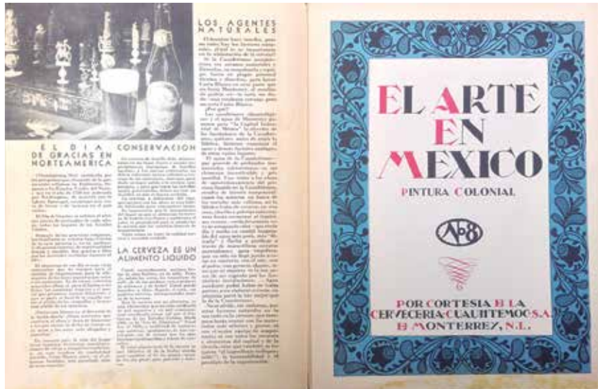
5. Contraportada y portada del anexo del Boletín Mensual Carta Blanca , noviembre de 1935. Colección particular. Fotografía del autor.