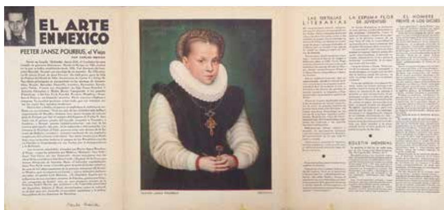
10. Páginas interiores desplegadas del Boletín Mensual Carta Blanca , marzo de 1936. Colección particular.