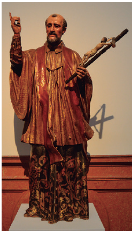
9. Anónimo, San Francisco Javier , siglo XVIII, talla en madera policromada, medidas desconocidas. Palacio Episcopal de Málaga.

los paños y el rostro característico de sus obras, no parece que pueda asegurarse esta atribución, aunque sí pertenecería a su círculo; en la última sala, es decir en la capilla, existe una talla policromada y estofada de autor anónimo y del siglo XVIII de san Francisco Javier (fig. 9).