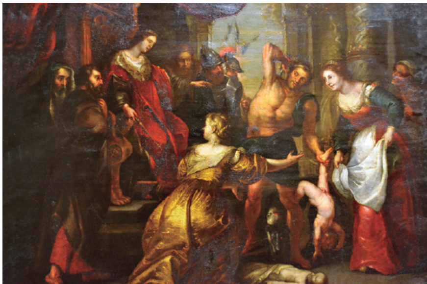
10. Frans Francken II, El juicio de Salomón , siglo XVII, óleo sobre cobre, 56 × 80 cm. Museo Diocesano de Guadix.

mentos pontificales, libros litúrgicos, mobiliario y un esterado de junco blanco en todo el suelo. El oratorio del segundo piso, menos decorado, contaba con un cuadro al óleo de la Presentación de la Virgen —en depósito—, un óleo de san Pablo, otro de san Torcuato, dos con cromos de los Sagrados Corazones, tres cuadros bordados, dos grabados en nácar y un lienzo roto del que “no se conoce la imagen” y que dicen que pertenece a la parroquia de La Peza. Además existía en este segundo oratorio un dosel de damasco y seda roja, 20 aras consagradas para las iglesias de la diócesis y numerosos ornamentos.