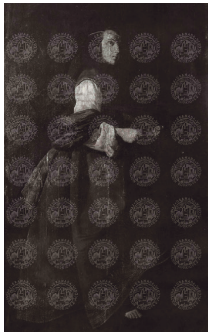
5. Francisco de Zurbarán (1598-1664), Santa Casilda, óleo sobre lienzo, medidas desconocidas. Palacio Arzobispal de Granada.

nio Moro; una santa Casilda de Zurbarán (fig. 5); 39 Apolo con el arpa acompañado de Pan; y la escultura de san Juanito, de Alonso Cano, que actualmente se encuentra en la catedral de Granada. En dos de estas fotografías se aprecia un gran tapiz con decoración de santos, delante del cual se sitúa una cruz de orfebrería y dos candelabros, en el reverso está escrito que la cruz es de bronce.