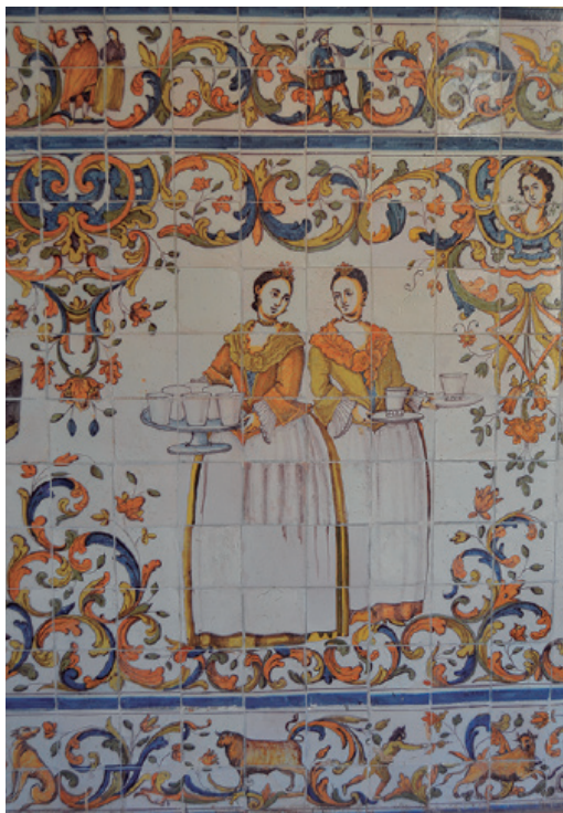
8. Azulejos trianeros del patio del Palacio Episcopal de Málaga.

ción de objetos existentes en el Palacio procedentes de espolios, por lo que no se toman en cuenta piezas con otra procedencia.