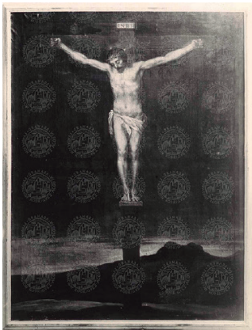
4. Crucificado, ca. 1640-1667, óleo sobre lienzo, medidas desconocidas. Palacio Arzobispal de Granada.