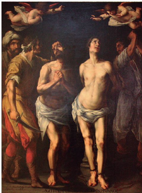
6. Sebastián Martínez Domedel, San Crispín y san Crispiano (163?), óleo sobre lienzo, 182 × 142 cm. Palacio Episcopal de Jaén.

Jaén, Sancho Dávila, hizo donación de “joyas, y riquezas, que de su casa envió delante el señor obispo para el ornado de la fiesta”. Entre estas “joyas” se encuentra un gran número de textiles de gran calidad, al menos en sus materiales.