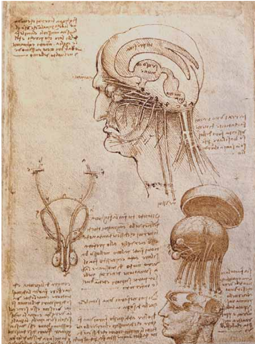
4. Leonardo da Vinci, Estudios anatómicos, pluma y tinta, ca. 1506-1508. Weimar, Schlossmuseum, KK 6287.