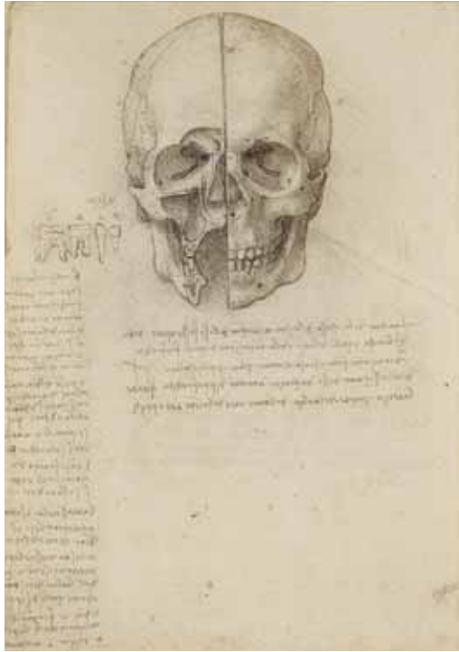
7. Leonardo da Vinci, El cráneo seccionado, pluma y tinta, ca. 1489. Windsor Castle, RL 19058r.

ne en efecto una cavidad propia, el ventriculo della impressiva — vinculado estrechamente con la capacidad misma de ver (la visión nocturna de ciertos animales respecto del hombre radica en la diferente proporción de la pupila y el lugar interior de esta facultad); 43 el ojo participa por ello también de la po-