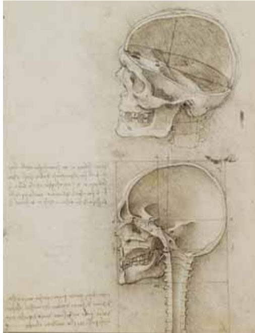
6. Leonardo da Vinci, El cráneo seccionado , pluma y tinta sobre tiza negra, ca. 1489. Windsor Castle, RL 19057r.

presentado en el esquema de las potencias en el temprano apunte del Codex Windsor (RL 12626r), 40 la pupila, que es por sí misma “de naturaleza aprehensiva”, está directamente conectada con la primera virtus : “Y este mismo círculo tiene en sí un punto, que parece negro, el cual es un nervio perforado que va hacia dentro a la potencia intrínseca, mismo que está lleno de la virtud impresiva y de juicio, que pasa al sentido común”. 41 De este modo, habría un spiritus impressivus 42 que va del ojo a la facultad que lo rige —la cual tie-