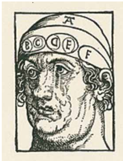
1. Albrecht Dürer, Caput phisicum (posible criptorretrato de Willibald Pirckheimer), grabado en madera. Tomado de Hollstein's German engravings, etchings and woodcuts 1400-1700 , vol. 7 (Ámsterdam: A. L. van Gendt, 1962), 205.

podía confundírsele con el logistikón (situado en el medio), pero que más bien era concebido como carente de localización física (del mismo modo que la voluntas ); es posible que con ello pretendiese destacar la primacía de la vista al señalarlo directamente vinculado con ella. Igualmente contradictor respecto de la más vasta tradición psico-fisiológica precedente es la ubicación del sensus communis en el ventrículo medio. Asimismo, en otro esquema contemporáneo ( Codex Windsor , RL 12627r) se distinguen (bajo luz ultravioleta) tres facultades: memoria , chomune senso e imprensiva , que corresponden a los ventrículos posterior, medio y anterior. 27 Esas tres potencias básicas de la clasificación leonardesca ( i.e. impressiva, senso comune, memoria ) se mantienen, si bien con una disposición más compleja y menos definida (la primera en un doble ventrículo superior que se extiende ampliamente por encima del medio, que acoge la segunda, y del que se desprende el último donde se ubica la tercera) en un dibujo a pluma de un estadio más maduro de sus investigaciones anatómicas