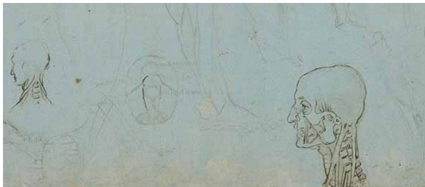
3. Leonardo da Vinci, Cabeza, punta de metal (desvanecido) y pluma y tinta, ca. 1487-1489, detalle. Windsor Castle, RL 12626r.

(Weimar, Schlossmuseum, KK 6287; 28 ca. 1506-1508) (fig. 4) y que empata con la representación de los importantes experimentos de inyección de cera de fecha cercana (Windsor Castle, RL 19127r, ca. 1508-1509) (fig. 5). 29