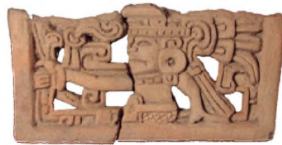
Proyecto Arqueológico Morgadal Grande, IIE

El proyecto se centra en el estudio de la época que abarca del siglo IX al X de nuestra era. Durante ésta se manifestaron en la ciudad y en su área de influencia varios momentos de cambio cultural, cuyo análisis pone de manifiesto