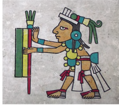
The Bodleian Library, University of Oxford, ms. Laud Misc. 678

El proyecto pretende definir el estilo de los códices Colombino-Becker I, Laud y Vindobonensis siguiendo una línea de investigación con el fin de identificar variedades estilísticas de la tradición pictórica del Posclásico.