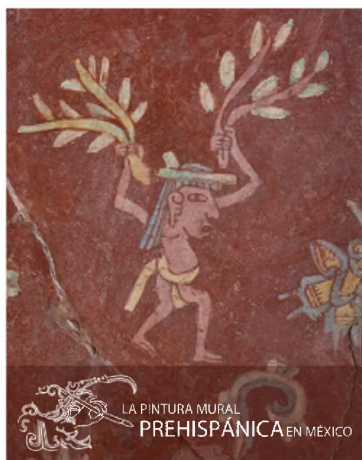
Proyecto Pintura Mural Prehispánica en México, III