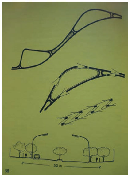
4. Diagramas que ilustran el Sistema Herrey. Imagen tomada de Pani, “México. Un problema, una solución”, op. cit. ( supra n. 8), p. 52. Fondo Mathias Goeritz. Archivo Cenidiap/INBA.

su papel como anuncio fue contundente con relación al éxito comercial del fraccionamiento. Las expectativas de sus inversionistas y promotores fueron rebasadas rápidamente. Al inicio de 1958, había ocho casas en Ciudad Satélite y se esperaba que en diciembre —conforme a un cálculo más que optimista— hubiera ya varias centenas de construcciones. 45 Es quizá esta fortuna comercial lo que llevó a Pedro Friedeberg a concluir en 1961 su “Relato histórico de la Torre” con un tono un tanto irónico y con el llamado “a los arquitectos y al pueblo de México en general, a seguir la alta tradición del pasado. Hay que construir torres cada vez más altas para el deleite del espíritu, del alma y de los negocios”. 46 Como se puede apreciar, los objetivos de la arquitectura emocional no riñeron con el mundo de la compra y venta de bienes raíces. La crítica que se podría dirigir al “negocio de la arquitectura emocional” continuó y se intensificó en los comentarios de Mauricio Gómez Mayorga, quien atribuyó a las Torres una práctica de “arquitectos dibujantes y publicistas” a la que llamó