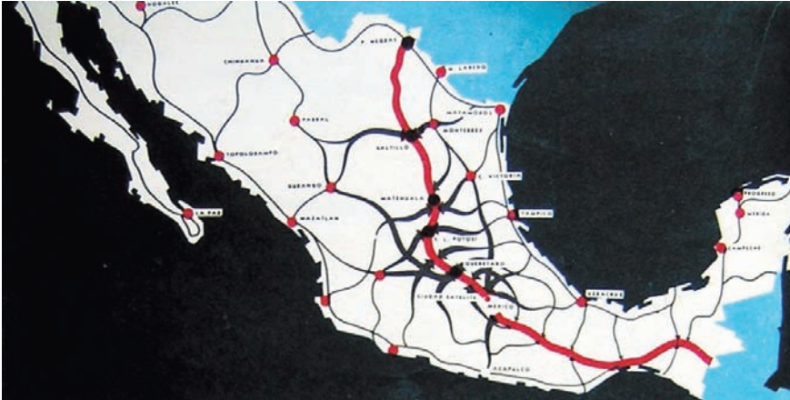
1. Ubicación de Ciudad Satélite en el Eje Central.

sión histórica de distintas propuestas de urbanismo y una particular perspectiva del ser humano que Pani imagina como usuario de su proyecto. 7 Sobre esto último, Pani juzga necesario crear espacios de reposo y recreación para que el hombre pueda descansar, pensar y reflexionar como “la única forma civilizada y culta de entender y de vivir la vida humana”. 8 Este tipo de espacios, donde figurarían las áreas verdes, son “vitales” para el autor del proyecto. Como el término lo sugiere, hay una clara influencia de las ideas de José Ortega y Gasset en la concepción del “usuario imaginario” propia de los planes de Pani. El factor de la convivencia como pilar del espacio social y punto de partida para la creación de una sociedad es una constante inquietud de ese arquitecto, que resuena de acuerdo con las ideas del autor de La rebelión de las masas . 9 Las previsiones