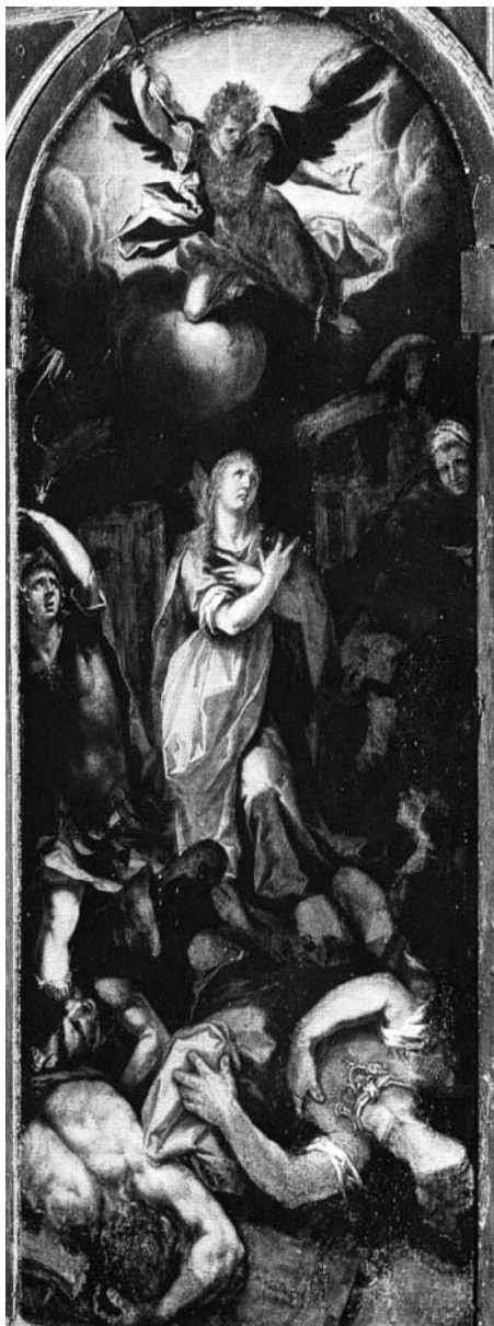
1. Alonso Vázquez, Martirio de santa Catalina , retablo de la Asunción, capilla de don Cristóbal de la Puebla. Catedral, Sevilla.