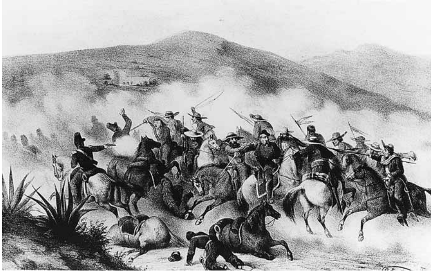
Figura 8. Constantino Escalante, Los exploradores mexicanos hacen prisionero a un jefe francés en las inmediaciones de Orizaba . Litografía en blanco y negro, 22 × 25 cm.

artista. La acción sucedió el 17 de mayo de 1863, cuando finalmente la ciudad de Puebla fue conquistada. Los soldados franceses, experimentados y disciplinados, protegiéndose en las trincheras, avanzan sus paralelas para alcanzar la aproximación necesaria hasta la línea de la que habían de surgir para el supremo asalto. La fortaleza mexicana recibe los impactos de la artillería de Forey y responde al duelo. El nerviosismo del ejército francés contagia al espectador. El cielo tenebroso, la silueta del edificio semidestruido y el compás de espera de los franceses aguardando la orden de sus comandantes expresan mejor que los partes oficiales la tensión de la batalla. Cuánta acción y cuánta angustia contenidas en unos cuantos centímetros cuadrados de papel. Jean Adolphe Beauce, pintor que vino en la expedición francesa, llevó al óleo la misma escena contemplada bajo el mismo ángulo visual de Escalante. Beauce era pintor de batallas y casi pintor de corte, de notoria formación académica. ¡Pero qué contraste entre esta obra suya y la litografía de Escalante! Aquella es una escena cuidadosamente estudiada, tranquila y descriptiva. La de Escalante es el patetismo, el hito histórico y la vivencia de la guerra.