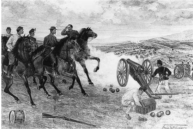
Figura 5. Francisco de P. Mendoza, Batalla de La Carbonera , 1910. Óleo sobre tela, 3,10 × 4 m, México, Palacio Nacional.

esencial y sobre todo más dotada de movimiento. Sin embargo, el restaurador remarcó precisamente lo que es el defecto de la obra: la figura de Porfirio procurando atraer la atención. El caballo que parece que vuela como una mariposa por encima y fuera del campo de batalla, saliéndose de todos los planos, y su jinete que, ignorando el objetivo de la carga, se vuelve hacia el espectador para exhibirse como el héroe. 21