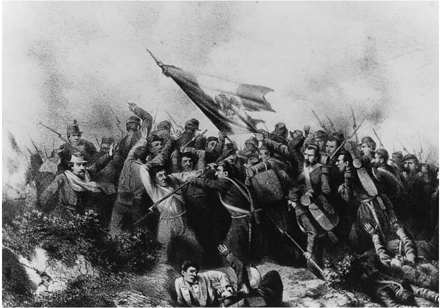
Figura 7. Constantino Escalante, Un episodio de la acción de Barranca Seca . Litografía en blanco y negro, 22 × 25 cm.

editó Iriarte y Compañía y sus ilustraciones se encargaron a Constantino Escalante. El contenido fue la guerra contra el Imperio, y de las batallas que Escalante litografió he seleccionado cuatro, para tener otro punto de vista en cuanto a la concepción de la obra, diferente a los óleos de Francisco de P. Mendoza.