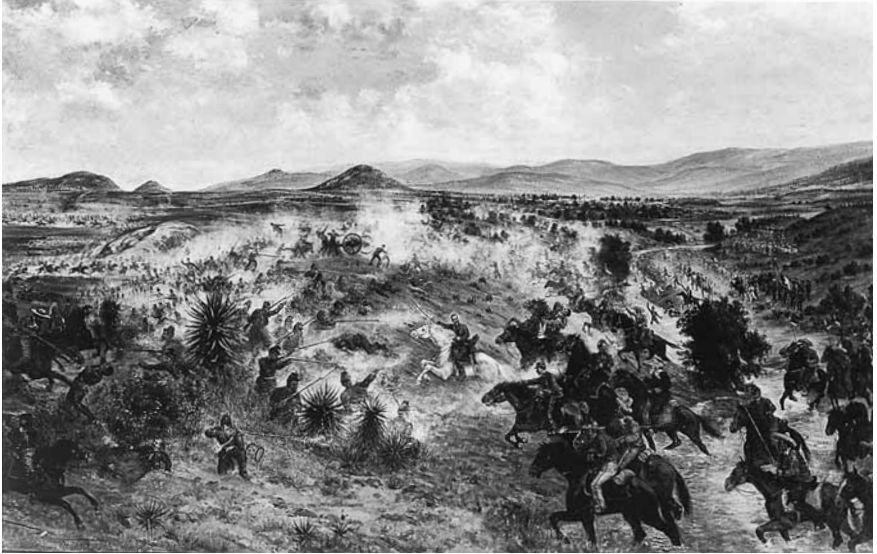
Figura 3. Francisco de P. Mendoza, Batalla de Miahuatlán , 1906. Óleo sobre tela, 1.29 × 2 m, Museo Nacional de Historia, inah.

absurdamente a la primera línea de lanceros, como si Díaz fuera a ganar él solo la batalla. Además, mientras aquéllos avanzan al trote, por tratarse de un cauce accidentado, el caballo de Díaz se lanza a galope tendido, como si intentara una innecesaria carga suicida. Y lo que constituye ya una sutileza es que el pintor haya destacado la cabalgadura mediante el color, pues entre toda la caballería es el único pintado de blanco; y esta única mancha blanca destaca y contrasta con un fondo en que se mezclan marrones, verdes y ocre cenicientos.