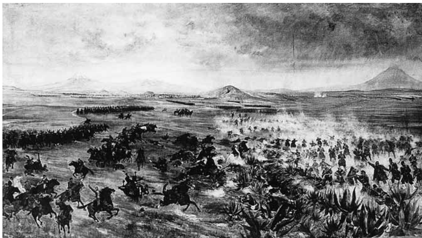
Figura 4. Francisco de P. Mendoza, Batalla del 5 de mayo . Óleo sobre tela, México, Museo del Ejército.

so en el lugar conocido como Rancho Azcárate. El pintor escogió el momento en que el cuerpo francés es detenido y atacado por la brigada de Díaz. Los soldados franceses presentan combate haciendo un ángulo y aprovechando los surcos y las magueyeras a manera de caballos de frisa. Porfirio, a caballo, es como un punto en torno al cual se mueve la caballería mexicana y hasta podría decirse que la escena entera, si el pintor hubiera tenido mayor habilidad en el manejo de masas. Por el contrario, evocó sus años de paisajista con una gran perspectiva. En el fondo, bajo el cielo grisáceo, se recorta pardusca la ciudad de Puebla, destacando las torres de su catedral y de San Francisco. A la derecha se eleva un cerro, que puede ser el de los fuertes, pero no se advierte actividad alguna. O es una falla del pintor o es que quiso retratarlo por el lado contrario al que ascendieron los zuavos de Lorencez. No sería tan extraño, pues conocemos más pinturas en que el glorioso 5 de mayo se redujo —sabemos por qué— a la acción en Rancho Azcárate. 20