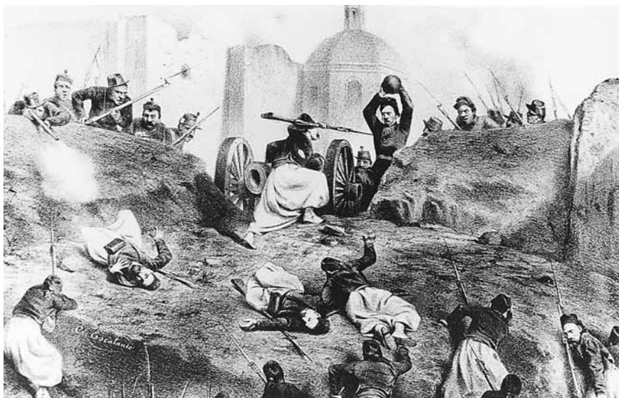
Figura 6. Constantino Escalante, Una escena del asalto del cerro de Guadalupe el 5 de mayo de 1862 . Litografía en blanco y negro, 22 × 25 cm.

Escalante, como los otros litógrafos, pudo haber asistido a la Academia sin seguir el largo aprendizaje del pintor o el escultor, sino confundiendo entre esos centenares de muchachos que solamente acudían para adiestrarse en el dibujo —práctica inveterada en las academias— y ejercerlo en algún oficio o en las artes aplicadas, que en este rango precisamente se colocaba a la litografía, por mucho tiempo desterrada de la culta academia a las escuelas de artes y oficios.