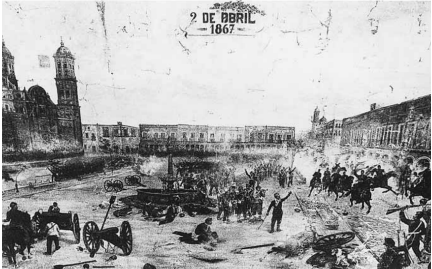
Figura 1. Francisco de P. Mendoza, Batalla del 2 de abril , 1905. Óleo sobre tela, 5 × 8 m, Museo Nacional de Historia, inah.

ferente porque no se trataba de escalar el poder, que Díaz había alcanzado muchos años antes, sino de conservarlo entre sus flácidas manos. Enfrentarse a la oposición exhibiendo lauros amarillentos.