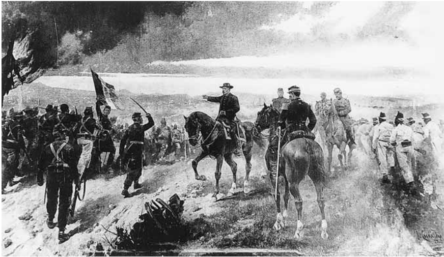
Figura 2. José Cusachs, Batalla del 2 de abril . Óleo sobre tela, 3.92 × 6.76 m, Museo Nacional de Historia, inah.

lo quemado, entre pertrechos y despojos, para hacernos sentir que la primera batalla estaba ganada y concluida. Pero, por otra parte, sentimos cómo se cierne lo incierto, lo inevitable y el riesgo borrascoso de una inminente segunda batalla en el paso apresurado —que casi podemos oír— de la columna de infantería, en uniforme blanco, que marcha al encuentro de Márquez. Cusachs, pintor extranjero que conocía la dureza de la guerra, rindió en su lienzo un emotivo homenaje al sufrido soldado juarista que derrotó a la intervención.