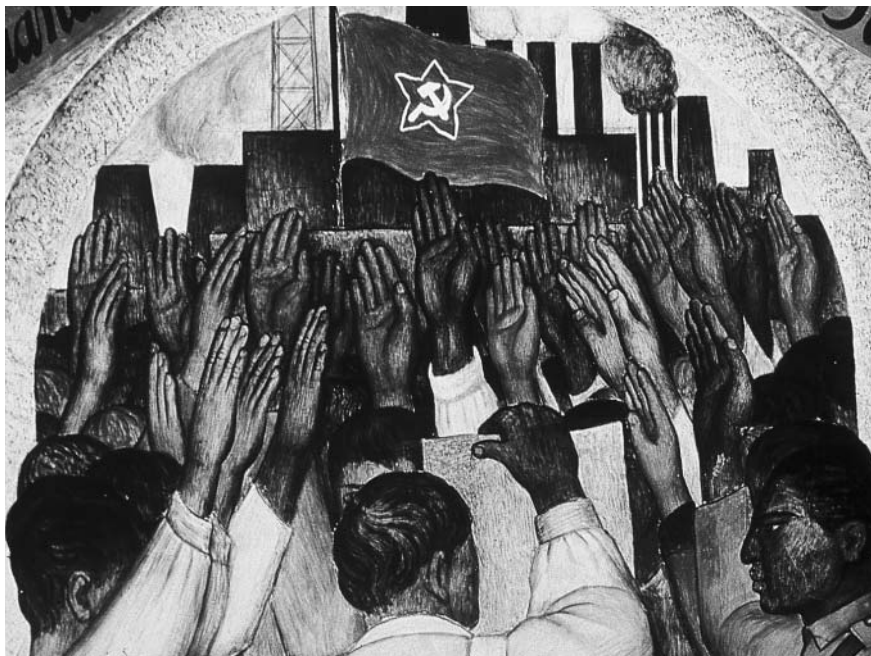
Figura 7. Diego Rivera, La protesta , detalle, Corrido de la Revolución , Secretaría de Educación Pública. Colección Tina Modotti, Archivo Fotográfico iie-unam.

bóvedas de Chapingo; pero también resalta el tratamiento artístico y formal. Así, observamos las virtuales líneas rectas ascendentes establecidas por las manos de La protesta , o del tablero El que quiera comer, que trabaje . Vemos también la composición a partir de líneas curvas en la cual las manos y los cuerpos adquieren suaves formas redondeadas, como en Las eras y en La danza de los listones . Están también las manos firmes que señalan, en Reparto de tierras o La cooperativa (figura 7).