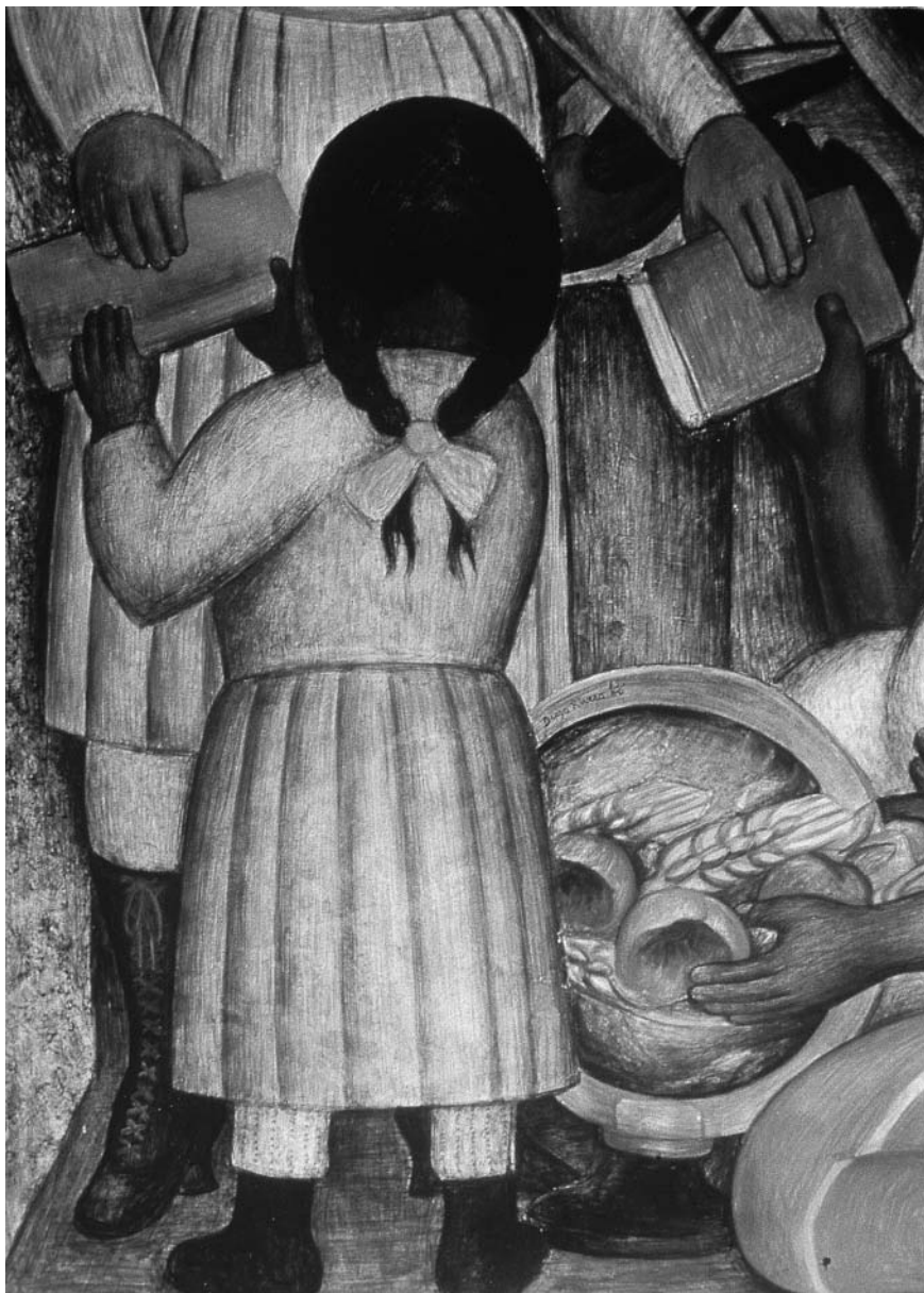
Figura 4. Diego Rivera, Alfabetización , detalle, tablero del Corrido de la Revolución , Secretaría de Educación Pública.