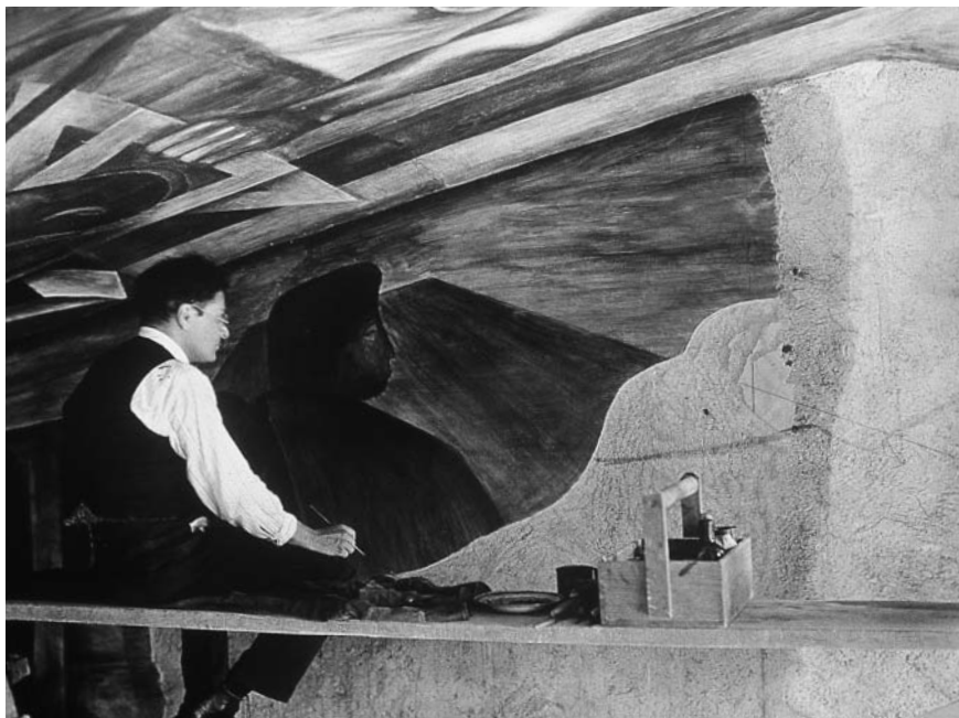
Figura 2. Clemente Orozco pintando un detalle de La familia campesina , Escuela Nacional Preparatoria, San Ildefonso.

Expresan también un discurso similar al exaltar el socialismo, al mostrar la oposición de clases sociales, en la constante alusión al trabajo y en el enaltecimiento de los trabajadores, ya sean obreros, artesanos o campesinos. Otros temas comunes son la productividad o la referencia a los líderes sociales. De esta manera, los temas se repiten con múltiples variantes y encontramos representaciones de obreros, campesinos, niños, mítines políticos, manifestaciones populares, manos de trabajadores, gente del pueblo; elementos simbólicos como mazorcas, la hoz, cananas, guitarras, banderas y estrellas (figura 3).