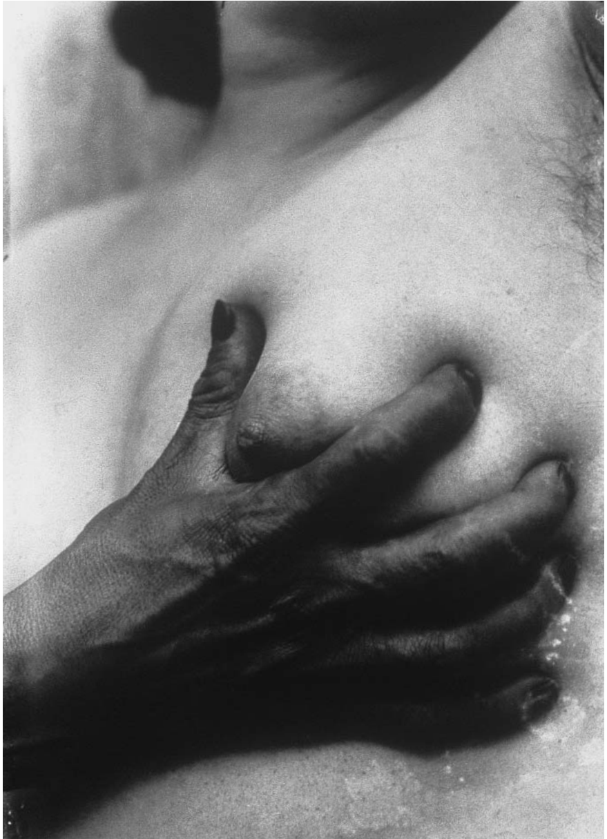
Figura 9. Luis Márquez, Sin título , década de los treinta.