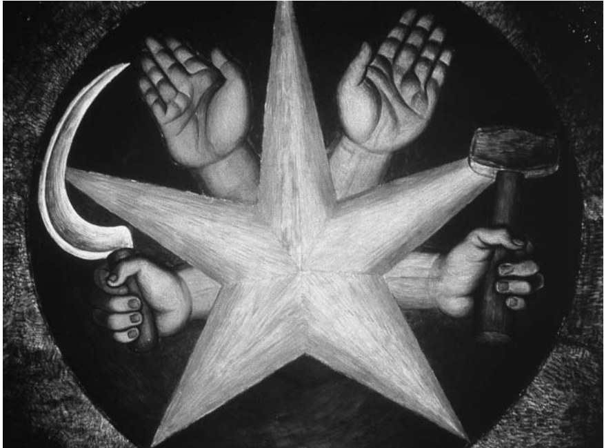
Figura 3. Diego Rivera, Símbolos del nuevo orden, Salón de Actos, Universidad Autónoma Chapingo.

Buñuel. La pintura de Carlos Mérida, Manuel Rodríguez Lozano, Roberto Montenegro, Rufino Tamayo y los muralistas de varias generaciones. El grabado de Leopoldo Méndez y los miembros del Taller de Gráfica Popular. La fotografía de Manuel Álvarez Bravo, Agustín Jiménez y Luis Márquez.