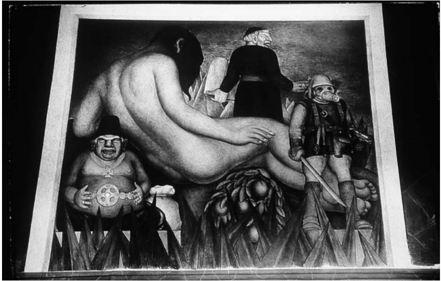
Figura 5. Diego Rivera, Tierra oprimida , muro lateral poniente, Desarrollo social , Salón de Actos, Universidad Autónoma Chapingo.

caso del tablero de la sep, Queremos trabajar , donde destaca al personaje de la parte superior con la vírgula de la palabra y el texto: “toda la riqueza del mundo proviene del campo”, o el de Alfabetización , donde se establece un paralelismo entre los productos de la tierra y la cultura, con la niña que recibe un libro y a su derecha aparecen espigas en un cesto en cuyo borde vemos la firma de Diego Rivera con la hoz y el martillo, o en el ritmo en dos tomas distintas del tablero La danza de los listones (figura 4).