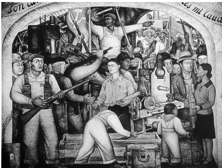
Figura 6. Diego Rivera, Entrega de armas o En el arsenal, Corrido de la Revolución, Secretaría de Educación Pública.