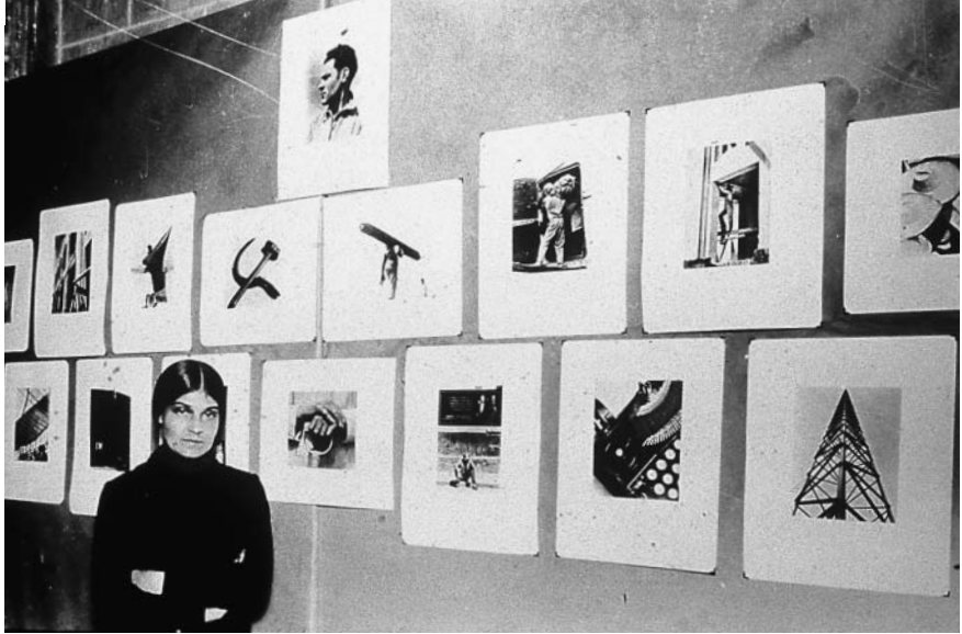
Figura 1. Tina Modotti en su exposición de la Biblioteca Nacional de la Universidad, 1929.

res como Diego Rivera, David Alfaro Siqueiros y Miguel Covarrubias e, incluso, estableció una relación íntima con otros, como Xavier Guerrero (figura 2).