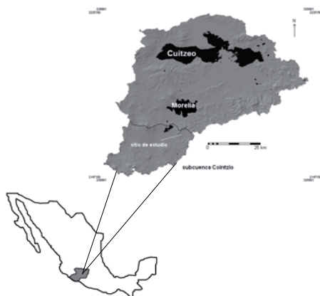
Figura 1. Localización del área de estudio.