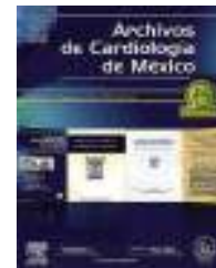
IMAGEN EN CARDIOLOGÍA