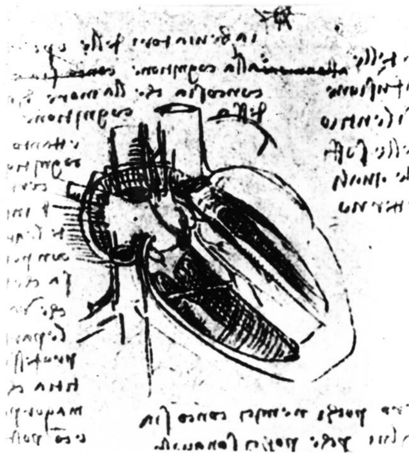
Figura 1 Esquema de un corazón abierto (dibujo de Leonardo da Vinci).

abanderado de los pioneros de la anatomía científica y tuvo la valentía de criticar los puntos de vista erróneos de Galeno en forma más decidida que el propio Vesalio 17 . No publicó ninguna obra monumental ni se preocupó mucho de la representación gráfica de las piezas anatómicas, pero fue el más cuidadoso investigador de la anatomía, indefessus magnus inventor en palabras de von Haller. Sus contribuciones más significativas consisten en el estudio del oído, la rectificación del trayecto de las arterias cerebrales, que en opinión de Vasalio se originarían en el seno, la descripción de las trompas uterinas, de los músculos oculares y de los nervios encefálicos. Su obra principal « Observationes anatomicae » (1561) 18 , junto con los tratados anatómicos de Juan Valverde de Amusco y de Realdo Colombo, se hallaban en la llamada Biblioteca Turriana de México 19 . Laín Entralgo 20 afirma que inició Falloppio la morfología genética y la estequiología biológica moderna y fue el verdadero forjador de la noción de «tejido».