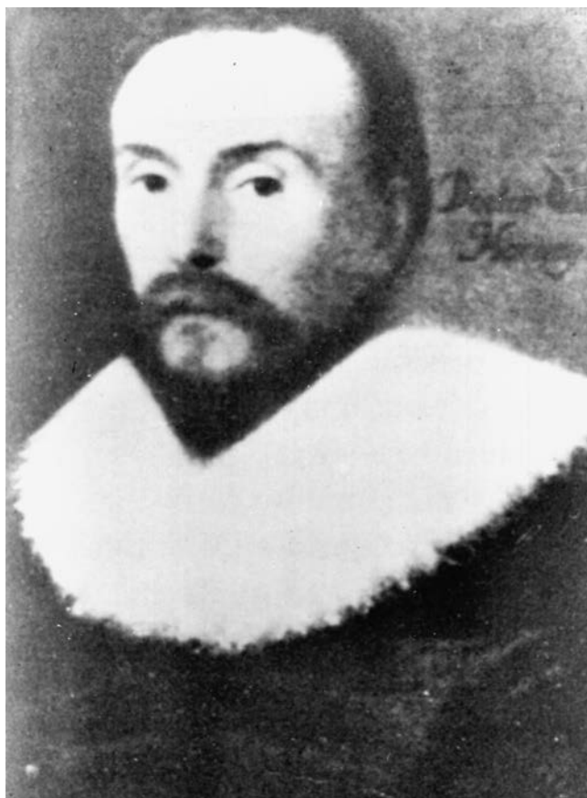
Figura 4 William Harvey (1578–1657).

torácico en el perro y en el hombre y se descubrieron los vasos linfáticos independientemente por Olof Rudbeck (1630–1702), Thomas Bartholin (1616–1680) y George Joyliffe (1621–1658).