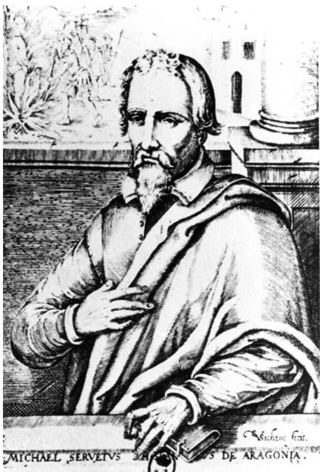
Figura 2 Miguel Servet (1511-1553).