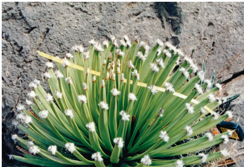
Fig. 2. Agave albopilosa I. Cabral, Villarreal & A. E. Estrada. Planta con hojas mostrando el mechón de pelos.