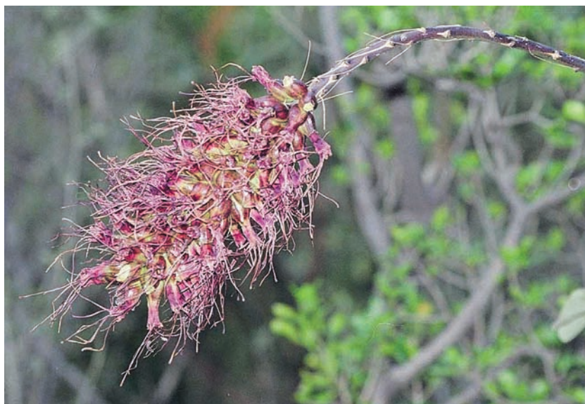
Fig. 3. Inflorescencia de Agave albopilosa I. Cabral, Villarreal & A. E. Estrada.