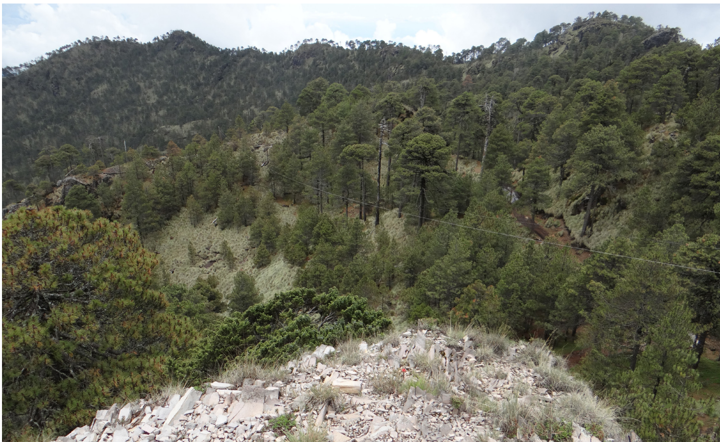
Figura 3: Pinar de la Gaultherio myrsinoidis - Pinetum hartwegii en las proximidades de la cumbre del Pico de Tancítaro, Michoacán, México.

pinar alcanzan su límite altitudinal de distribución en torno a 4000 m s.n.m. (Beaman, 1962; Lauer, 1978; Miranda y Hernández-X, 2014), aunque su límite inferior se sitúa unos 200 m por encima del registrado aquí, debido al efecto de “elevación en masa” (Troll, 1973), propio de montañas más elevadas. En otros volcanes notables de la Franja Volcánica como el Nevado de Colima, la Malinche y el Pico de Orizaba, se presentan bosques análogos a los aquí descritos; falta estudiarlos bajo la óptica fitosociológica para conocer su composición y correspondiente adscripción sintaxonómica.