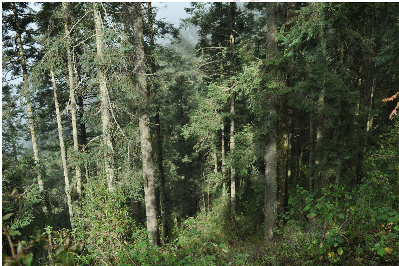
Figura 4: Oyamental de la Polysticho speciosissimae-Abietetum religiosae en el cerro Tangarico, Michoacán, México.

Bioclimáticamente la franja que ocupa se corresponde con el horizonte Supratropical superior de ombrotipos Húmedo e Hiperhúmedo. En su límite superior de distribución contacta con los pinares orotropicales de la Gaultherio myrsinoidis-Pinetum hartwegii descrita anteriormente. En su límite inferior lo hace con el otro bosque de oyamel aquí reconocido (descrito a continuación), y con el cual comparte varias especies, aunque presentan diferencias determinantes en su composición y distribu-