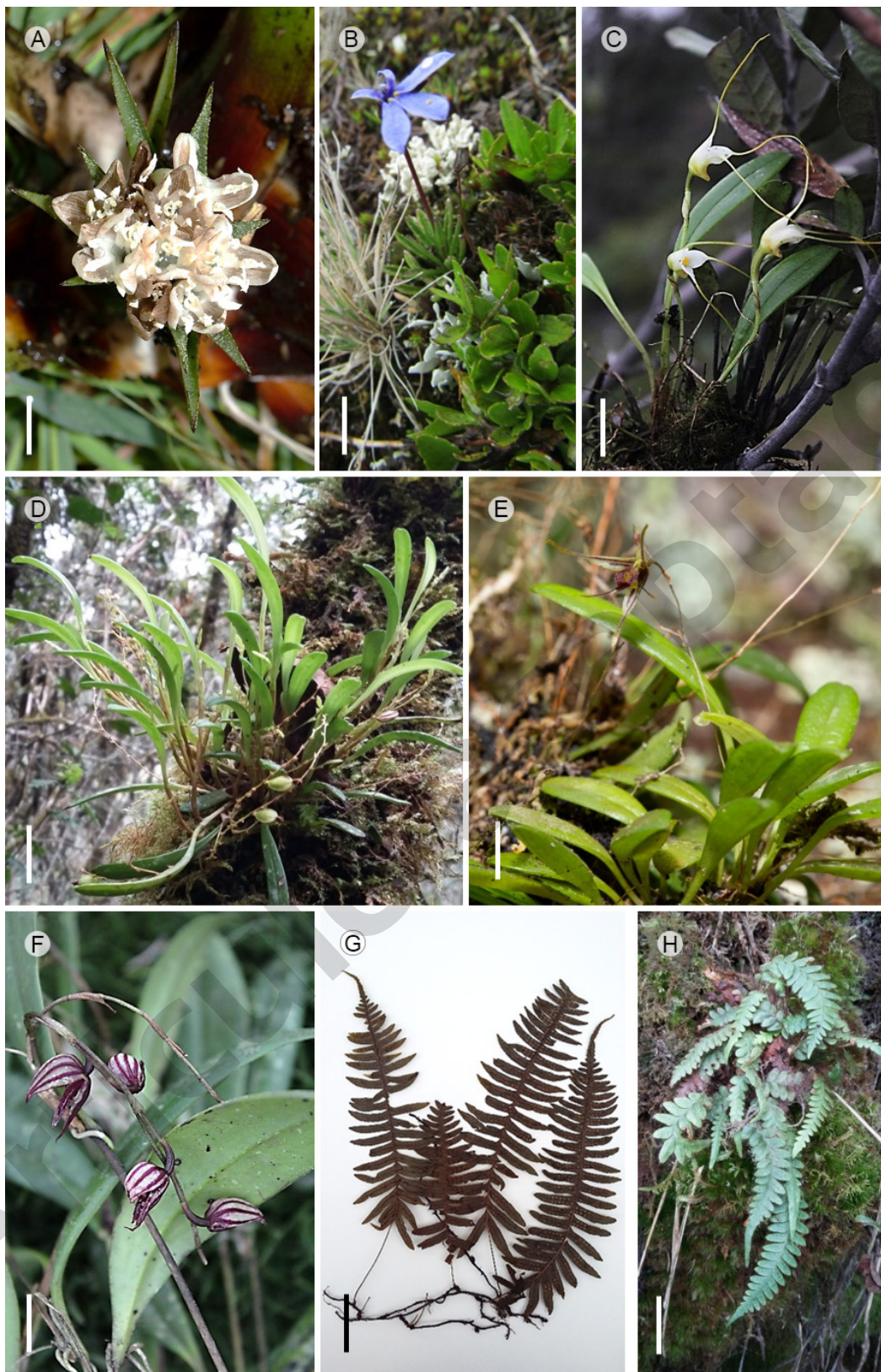
Figura 2: Nuevos registros de especies vegetales para el departamento Boyacá, Colombia. A. flor de Greigia collina L.B. Sm.; B. hábito general y flor de Lobelia nana Kunth; C. hábito y vista de las flores de Masdevallia strumifera Rchb. f.; D. vista del hábito de Stelis pusilla Kunth; E. vista del hábito y de la flor abierta de Specklinia macroblepharis (Rchb. f.) Pridgeon & M.W. Chase; F. vista de las flores en preantesis de Pleurothallis lindenii Lindl.; G. exicado con vista general de Polypodium wiesbaueri Sodiro; H. hábito de Terpsichore asplenifolia (L.) A.R. Sm. Escala, A=1.5 cm; B=1 cm; C=1 cm; D=1 cm; E=0.5 cm; F=1.5 cm; G=5 cm; H=2.5 cm.