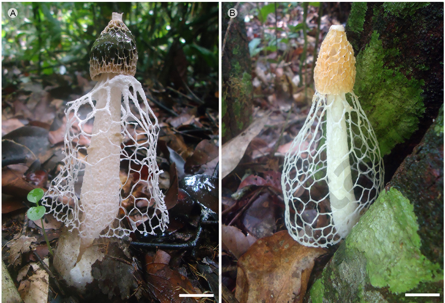
Figura 2: Basidiomas maduros de especies del complejo Phallus indusiatus Vent., encontrados en la Reserva Extrativista (RESEX) Tapajós-Arapiuns, Pará, Brasil. A. ejemplar encontrado en Vila Franca; B. ejemplar encontrado en Maripá. Escala: A, B=2 cm.

esponjoso, color blanco, hueco, alveolado a poroso, superficie ligeramente papilada; receptáculo 3-4 × 1-2 mm, cónico, con un poro en el ápice, superficie irregularmente alveolada, color blanco, cubierta por la gleba, color verde-oliváceo oscuro, maloliente; indusio color blanco, 6-9 cm de alto, bien desarrollado, colgando desde el interior del receptáculo, muy delicado; basidiosporas 3-3.5 × 1.5-2 µm, elipsoides a cilíndrico-elipsoides, lisas, pared delgada, sin apículo, hialinas.