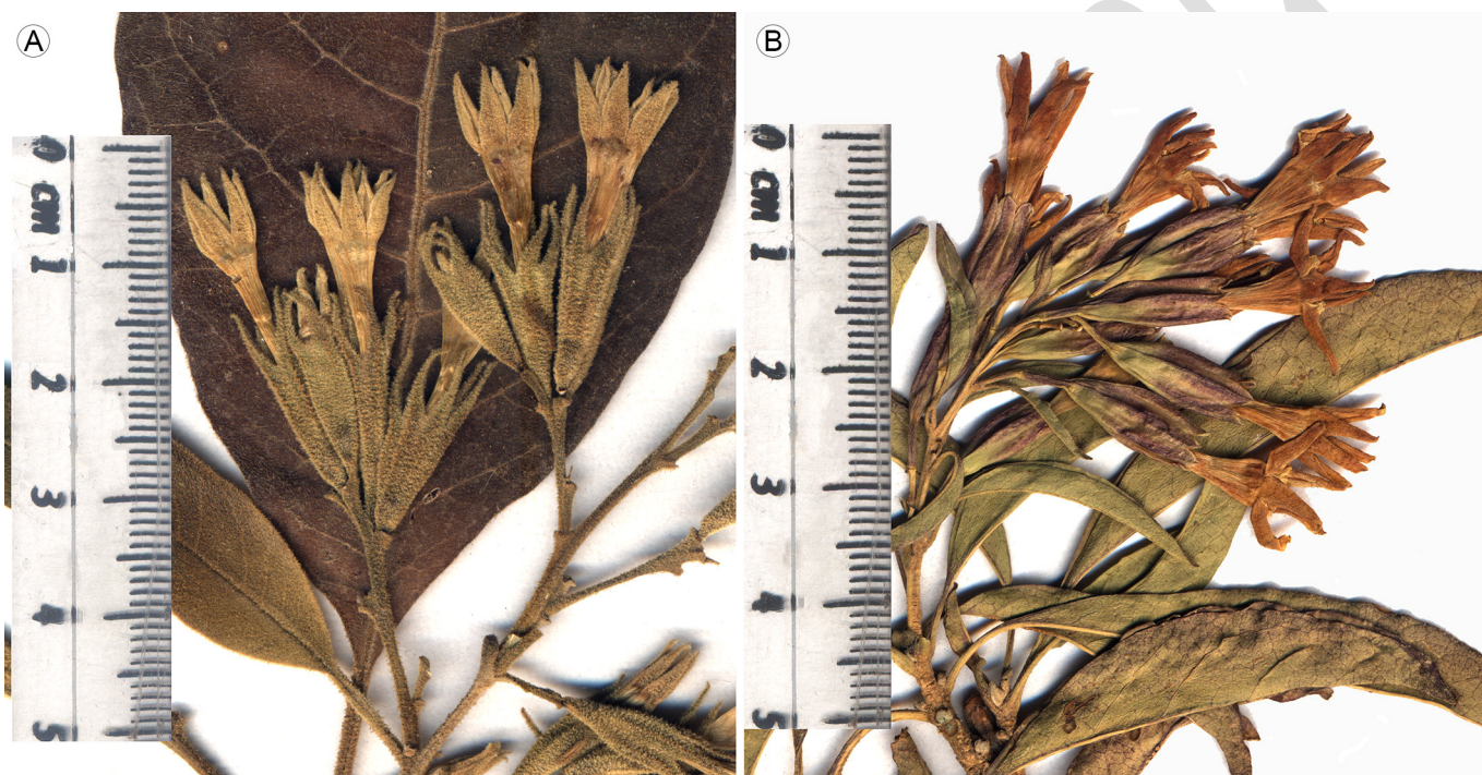
Figura 2: A. inflorescencia de Cestrum chiangi Mont.-Castro ( Delgado-Salinas 2553 , holotipo: EBUM!); B. inflorescencia de C. fulvescens Fernald ( Medina 1562 , EBUM).

Cestrum chiangi desarrolla un cáliz de 15-17 cm y cubre 3/4 de la corola, lo cual no es común en las especies mexicanas del género. Sin embargo, se podría confundir con Cestrum fulvescens Fernald, aunque el cáliz de C. chiangi es tomentoso, con lóbulos acuminados y las costillas, aunque conspicuas, no son aladas (Fig. 2A), mientras que el cáliz de C. fulvescens es glabro con lóbulos deltoides irregulares y con costillas aladas (Fig. 2B). Otras especies en México que presentan cáliz tomentoso son C. fasciculatum (Schltdl.) Miers, C. roseum Kunt, C. mortonianum J.L. Gentry y C. tomentosum L. f. Las primeras dos especies no se pueden confundir, ya que presentan tricomas simples y el color de cáliz y corola es en tonos rojizos. Cestrum mortonianum , C. tomentosum y C. chiangi tienen tricomas dendroides y el color de cáliz y corola es verdoso, pero el cáliz excepcionalmente largo de C. chiangi sirve para discriminarla. Las primeras presentan un cáliz corto, menor a 1/3 del tubo de corola y sin costillas evidentes.