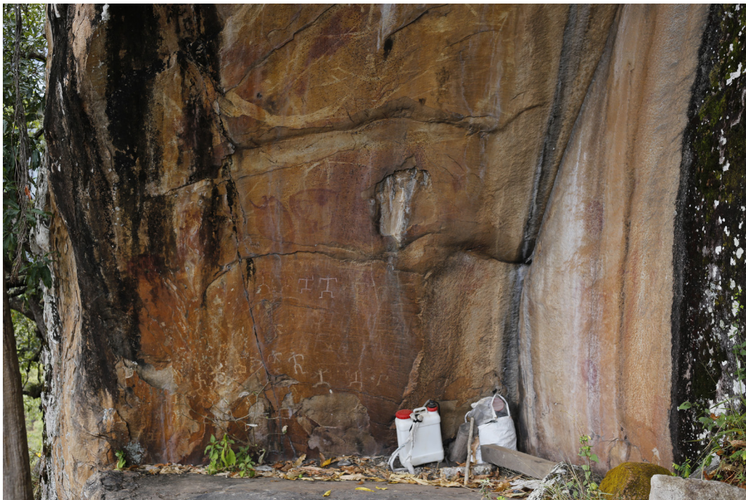
Figura 4. Abrigo rocoso Piedra Cruz Virgen donde realizan ofrendas de guajolotes por la cosecha. Las pinturas son personas con movimientos probablemente representando un baile.

Por otro lado, los objetos que fueron elaborados por los wlhash también contienen facultades para incidir en la vida de los zapotecos. Señor Mundo, campesino de 35 años, explica cómo los “viejitos de antes dicen que cuando uno se encuentran santitos se deben cuidar y adorar, ponerle flores y respetar para que tengan una buena