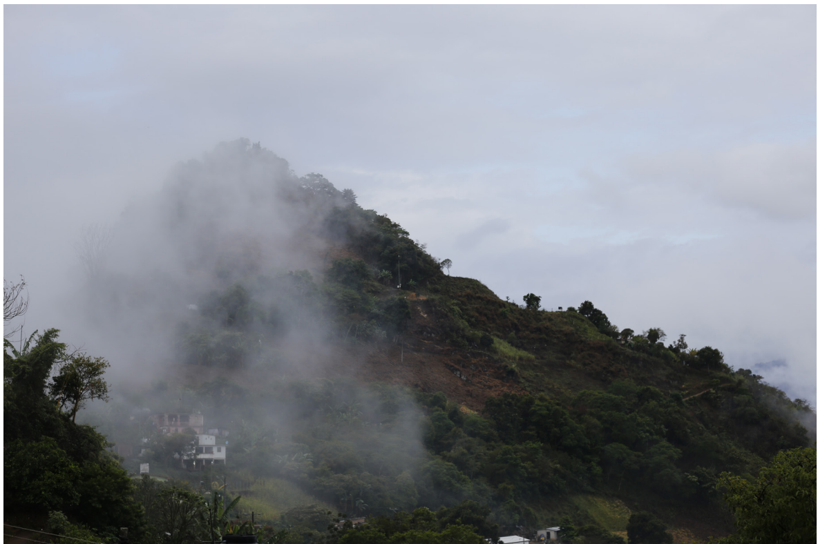
Figura 3. En la ladera norte del cerro Ya Yatza se pueden observar algunas de las terrazas prehispánicas.