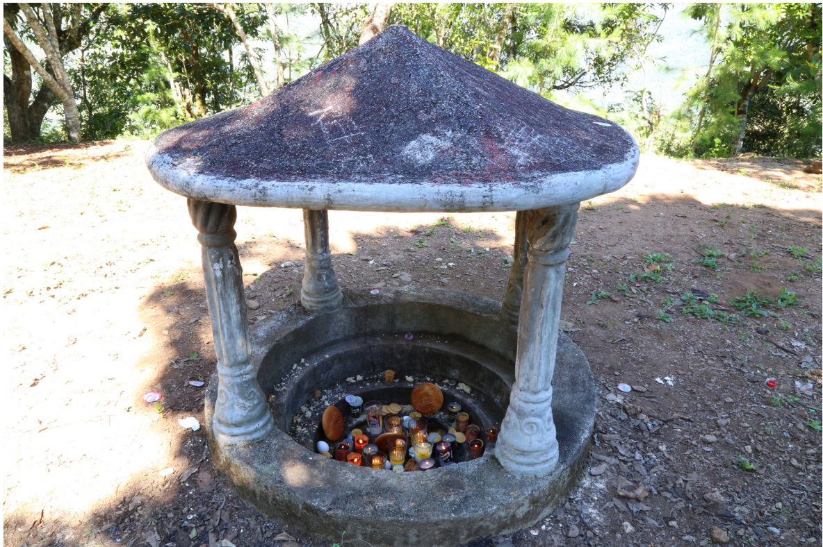
Figura 2. Nicho con ofrendas construido en la plaza prehispánica situada en la cima del cerro Ya Yatza. (fotografía de Carlos Gallegos).