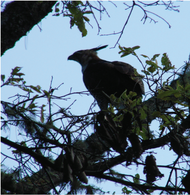
Figura 2. Fotografía de un juvenil de águila elegante ( Spizaetus ornatus ) en un bosque de encino-pino de la Reserva de la Biosfera de Manantlán, Jalisco-Colima, en vista de perfil, donde se aprecia la silueta con la cresta característica.