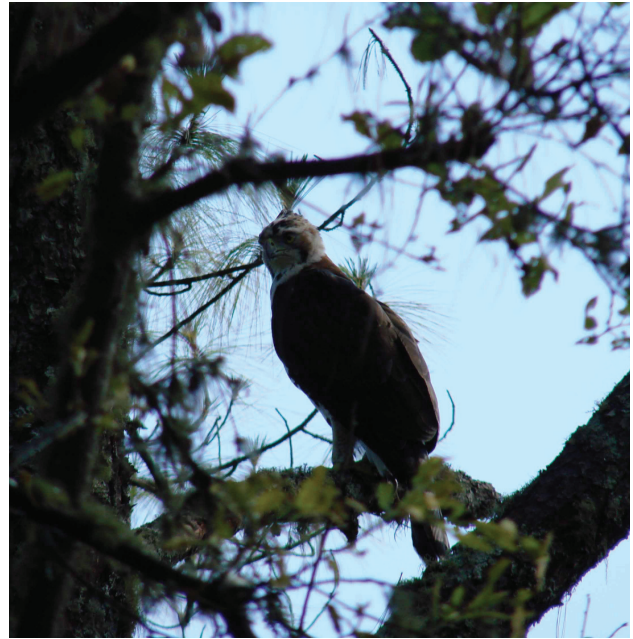
Figura 3. Fotografía de un juvenil de águila elegante ( Spizaetus ornatus ) en un bosque de encino-pino de la Reserva de la Biosfera de Manantlán, Jalisco-Colima, de frente, donde se aprecia el plumaje de la cara y cuello característicos de un subadulto de 2-3 años de edad.

evidencias del fracaso de 2 y de los otros 3 hubo dudas.