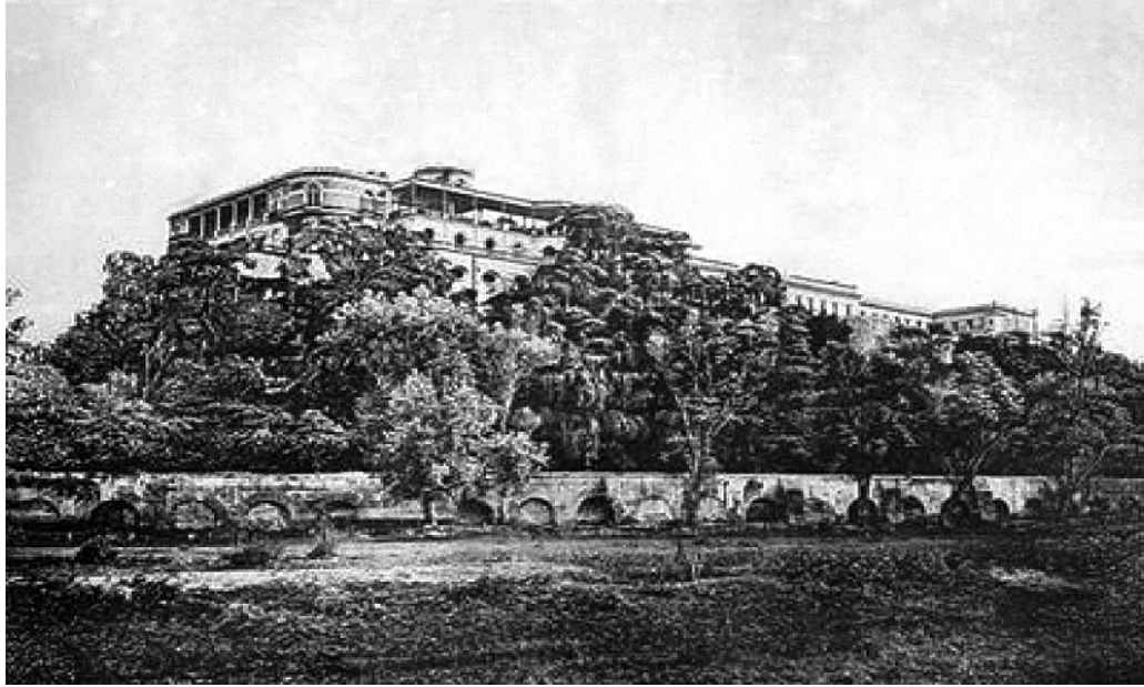
Figura 6. Castillo Imperial de Chapultepec. Ciudad de México. Circa 1866.