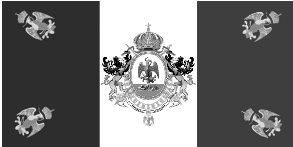
Figura 7. Bandera del II Imperio Mexicano de Maximiliano de Habsburgo