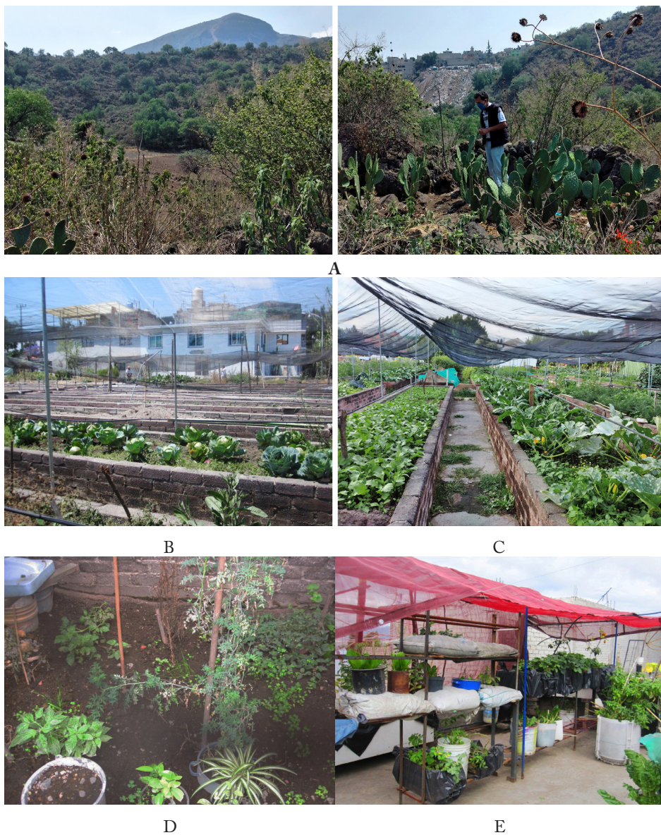
Figura 2. A: Terreno usado para la agricultura en la Sierra de Santa Catarina (julio de 2020). B: Huerto antes del COVID-19 (marzo de 2019). C: Huerto durante la pandemia (julio de 2020). D: Huerto en Valle de Chalco antes de la pandemia de COVID-19 (enero de 2020). E: Huerto durante la pandemia (julio de 2020).