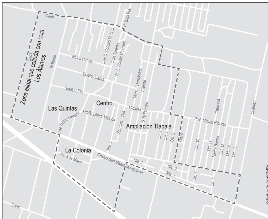
Figura 5 - Espacios de diferenciación entre los habitantes de Tlapala.

Uno de los primeros autores que distinguió el problema de la existencia de la vida metropolitana y la individualidad fue Georg Simmel (2005). El documento clásico La metrópolis y la vida mental destaca la importancia de la experiencia y el enfoque cualitativo no sólo para describir, sino ayudar a entender cómo la metrópolis pone en tensión la imagen del ser humano en general y las manifestaciones singulares