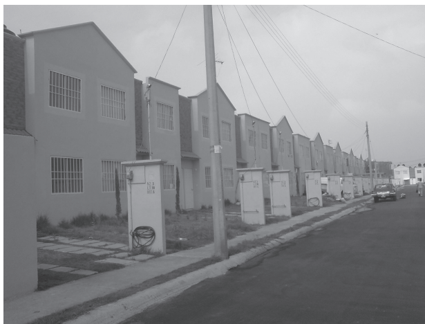
Figura 1 - Casas modelo e imagen de un cuís. Naucalpan, México.

Entre 1999 y 2010, según Carolina Pedrotti (2010), el Estado de México alojó 365 conjuntos urbanos con un total de 617 250 viviendas. Los municipios de la zona metropolitana en los que mayor número de viviendas nuevas se autorizó son Tecámac, con 128 349; Zumpango, con 80 210, y Huehuetoca, con 67 589. La decisión fue deliberada, pues estos tres ayuntamientos forman parte de lo que se denominó Ciudades del Bicentenario, una estrategia del gobierno mexiquense para urbanizar 31 453 hectáreas en 20 años. El propósito era impulsar “ciudades modelo, debidamente estructuradas, ambientalmente sustentables y altamente competitivas”, como consigna el plan elaborado por la Secretaría de Desarrollo Urbano Estatal (GEM, 2007; Pedrotti, 2010; Salinas, 2016).