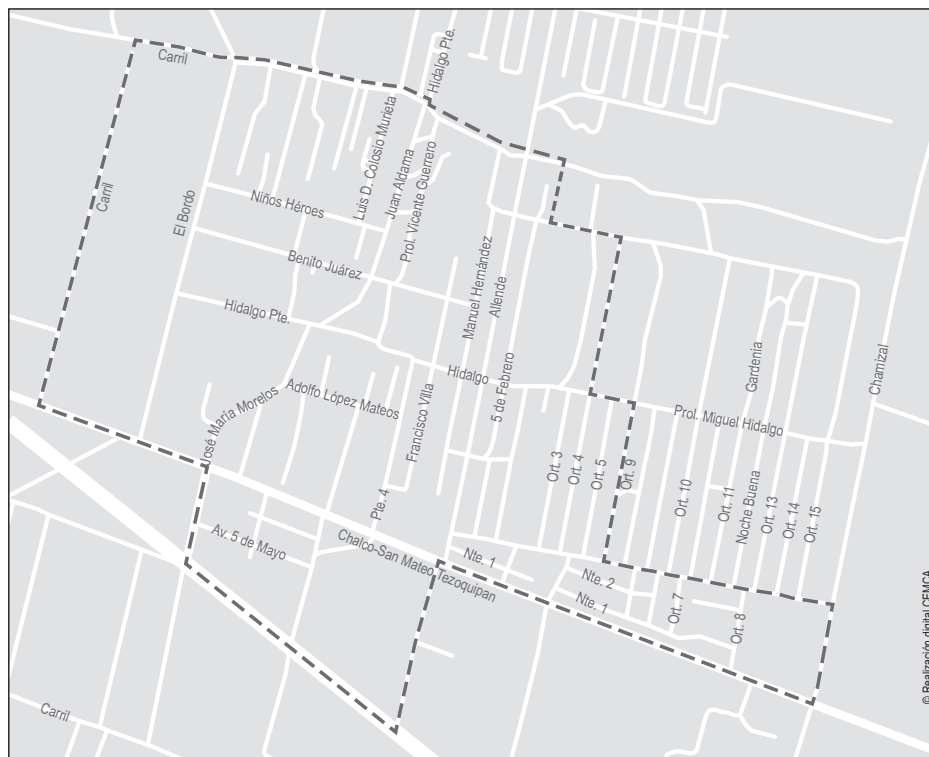
Figura 4 - Los Álamos y La Candelaria Tlapala.

En ese contexto, en mayo de 2005, se decidió aplicar un breve cuestionario para conocer las narraciones acerca de dos conceptos clave en torno a la identificación local de los habitantes: pobladores y pueblo. Se consideró la identificación de una experiencia secuencial del crecimiento de Tlapala: la consolidación del poblado