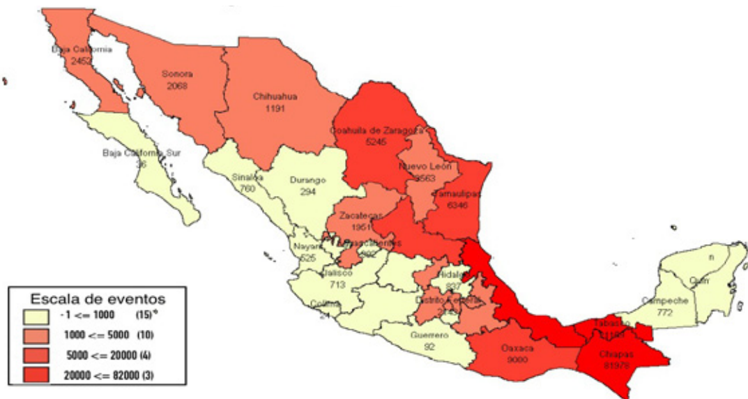
Mapa I. Eventos de extranjeros presentados ante la autoridad migratoria según entidad federativa, 2015.

18