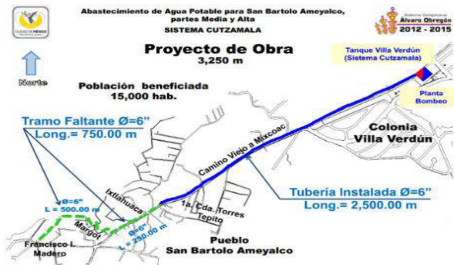
Imagen 2. Proyecto de obra hidráulica en San Bartolo Ameyalco