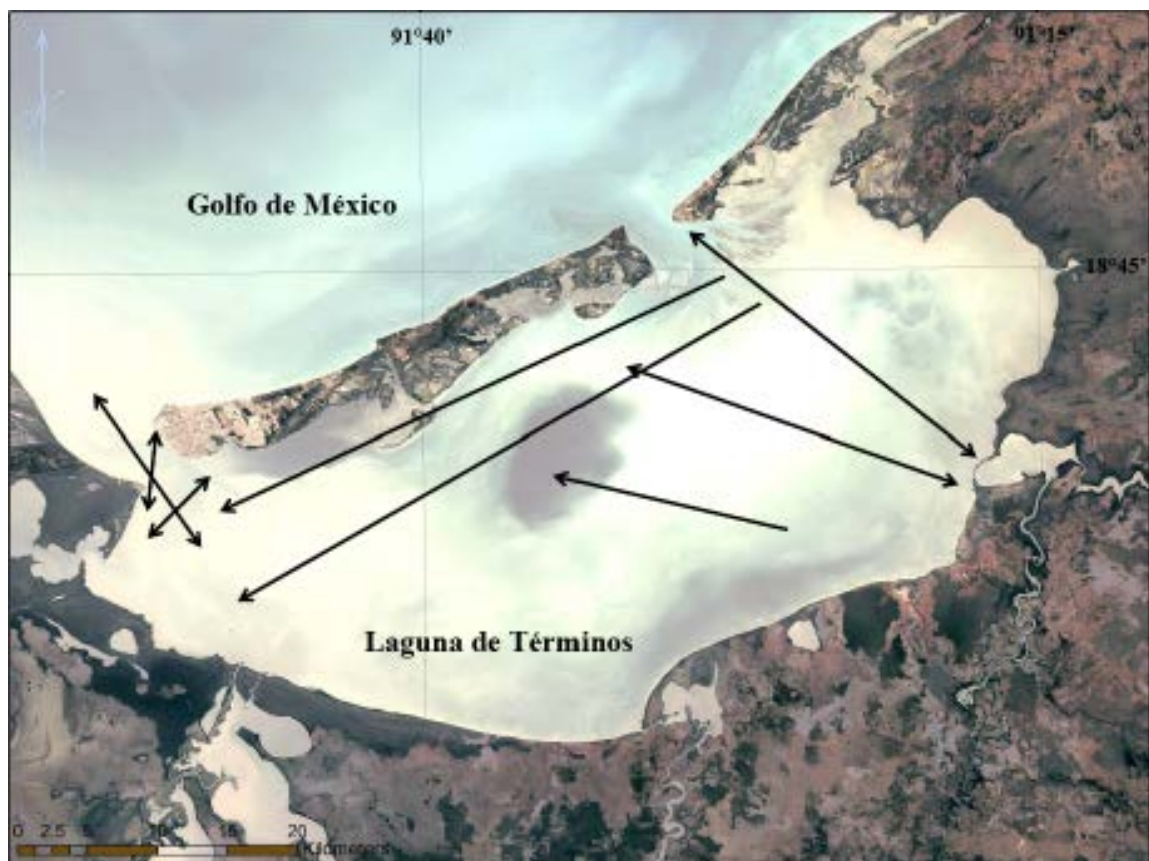
Figura 2. Movimientos más comunes de las toninas en la laguna de Términos, Campeche (Tomado de Google Earth, 15 abril, 2015, y modificado por el autor).

La zona de isla Holbox presentó 14 casos de reavistamientos. Seis individuos solo presentaron un reavistamiento, cuatro de ellos en el mismo año y los restantes en años diferentes, pero en zonas muy cercanas, con excepción de un individuo que primero se localizó en la laguna de Yalahau y posteriormente tres años después se observó en el Golfo de México. Seis ejemplares presentaron dos recapturas, la más interesante fue de los individuos TTIH-037 y 044, que se vieron