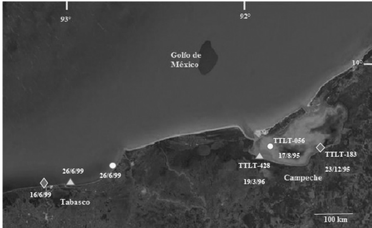
Figura 4. Movimientos realizados por las toninas identificadas por primera vez en la laguna de Términos y reavistadas años después en la costa de Tabasco (Tomado de Google Earth 15 abril, 2015, y modificado por el autor).

En la boca de Puerto Real se registró un grupo de cinco toninas que tuvieron diferentes grados de mutilación en la aleta caudal y siempre fueron localizados en esta boca o en sus cercanías, es decir en el delta interno. Todos estos individuos se identificaron por primera vez en 1989 y se fueron registrando a lo largo del estudio de manera irregular. Únicamente uno de ellos presentó