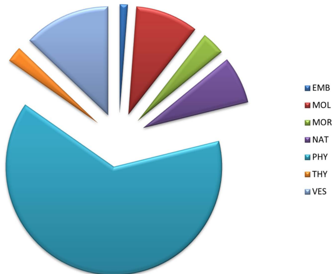
Figura 1. Distribución taxonómica (por familias) del total de cambios en el número de especies reconocidas en el periodo comprendido entre Simmons (2005) y esta revisión. Phyllostomidae = 63.53%; Vespertilionidae = 12.94%; Molossidae = 9.41%; Natalidae = 7.06%; Mormoopidae = 3.53%; Thyropteridae = 2.35%; Emballonuridae = 1.18%.

subespecies o sinónimos de especies válidas existentes.