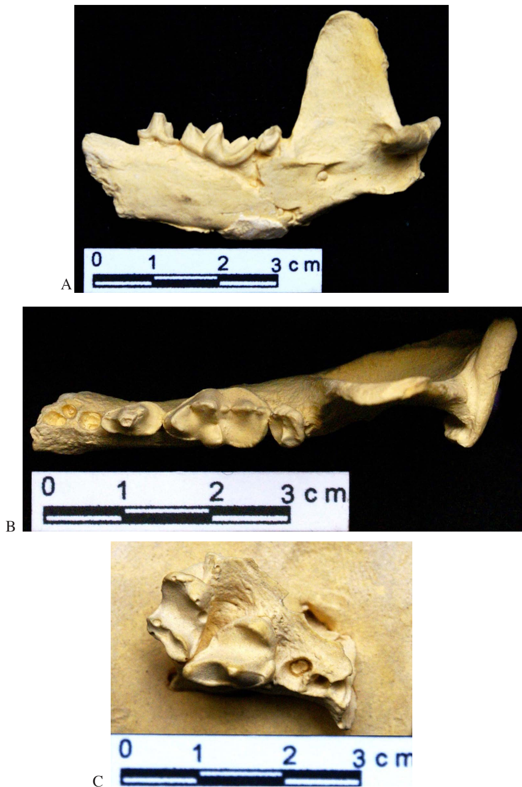
Figura 2. Fotografías de las réplicas (DP 1224) del fragmento de mandíbula izquierda (A, B) y de la maxila izquierda (C) de un ejemplar de la nutria neotropical Lontra longicaudis , procedente de los yacimientos del Lago de Chapala, Jalisco. Las fotografías corresponden a: A) Vista lingual; B) Vista oclusal; C) Acercamiento del diente carnasial.

de Paleontología de Guadalajara, aunque los ejemplares no se localizaron en esta ocasión; afortunadamente, existen dos réplicas de una maxila y un dentario, que están depositadas en la Colección Paleontológica del Laboratorio de Arqueozoología "M. en C. Ticul Álvarez Solórzano" como un lote bajo el mismo número de catálogo (DP 1224), Subdirección de Laboratorios y Apoyo Académico, INAH (Fig. 2).