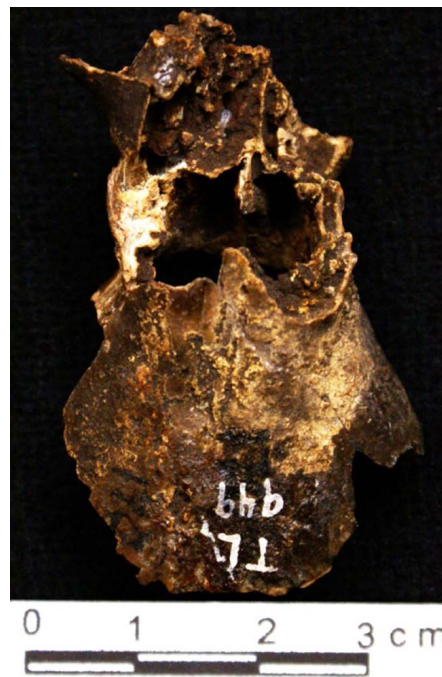
Figura 3. Fotografías de los fragmentos de un cráneo DP-949 de un ejemplar de la nutria neotropical Lontra longicaudis , procedente del sitio arqueológico-paleontológico de Tlapacoya, Estado de México. Las fotografías corresponden a: A) Región basioccipital; B) Vista ventral/oclusal de una porción del maxilar con el diente carnasial izquierdo; C) Vista dorsal de la región frontal.

El uso del nombre que los autores arriba señalados hacen de Lutra canadensis corresponde a la propuesta de ese entonces (ver, por ejemplo, Hall y Kelson 1959); no fue sino hasta que Van Zyll de Jong (1972) revisó las nutrias y propuso que las especies americanas que pertenecían a Lutra , en realidad deberían estar asignadas al género Lontra Gray, 1843. Además, existen dos especies en Norteamérica, L. canadensis se distribuye en gran parte de Norteamérica, al norte de México de donde fue extirpada en el pasado (Álvarez-Castañeda 2000), mientras L. longicaudis ocupa gran parte del territorio mexicano, desde