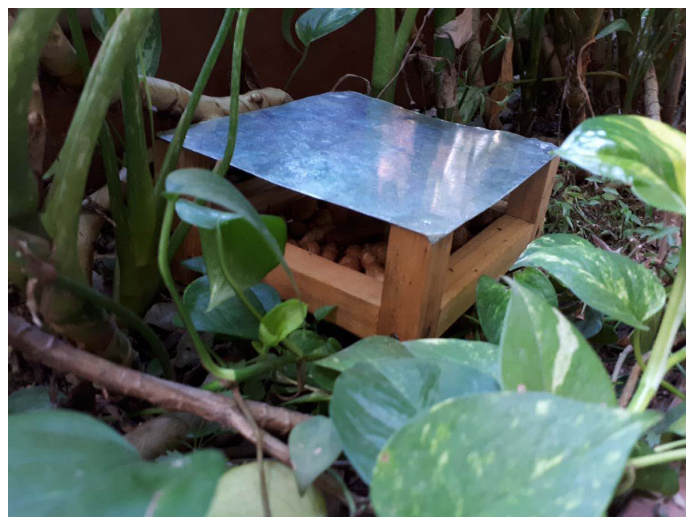
Figura 2. Alimentador. Se colocaron 16 estaciones de comida (un alimentador por estación) en un patrón uniforme, en cada una de las tres parcelas con aumento alimenticio.

Para la estimación de la densidad poblacional se dividió la abundancia por el área efectiva de trampeo. El área