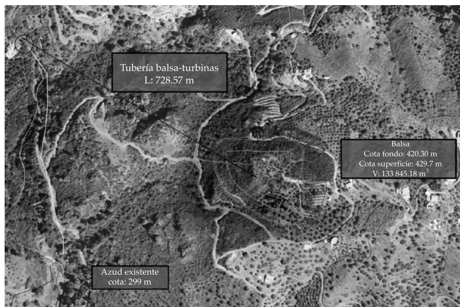
Figura 3. Diseño de nueva balsa de almacenamiento y regulación, con una capacidad de 133 845.18 m 3 , situada a una cota de 430 msnm.