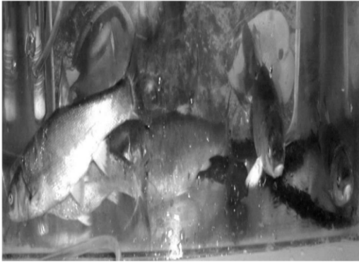
Figura 2. La especie de pez Algansea lacustris adulto.

Girard (1856) y Steindachner (1895), citados en Rivera y Orbe (1990), mencionan una breve descripción del ciprínido nativo del lago de Pátzcuaro Algansea lacustris , el cual se denota como un organismo poco estudiado, a pesar de ser una especie económicamente importante en la región y presentar grandes posibilidades de explotación controlada.