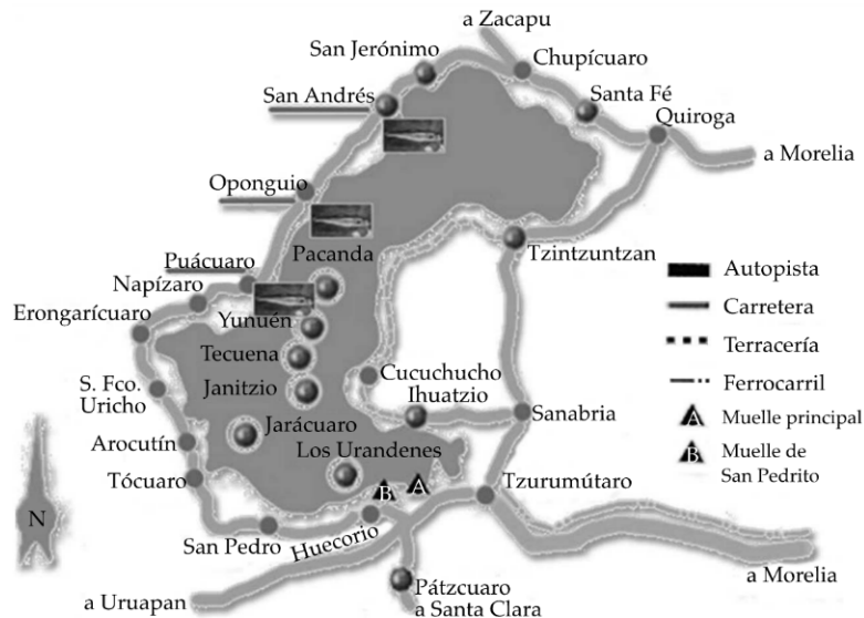
Figura 3. Áreas de muestreo de Algansea lacustris .