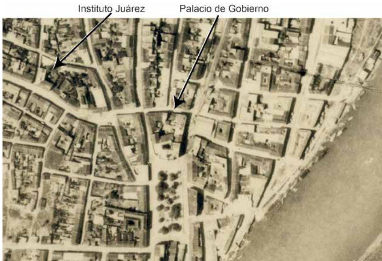
Imagen 4. Villahermosa y alrededores (detalle), 1931-1934

Fuente: Centro Documental de Estudios sobre el Agua, planero N° 4, Gaveta N° 3 del área de consulta.