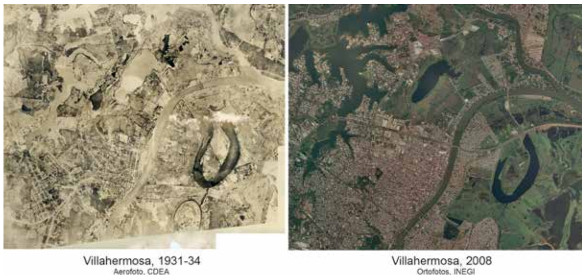
Imagen 10. Comparativo de imagen de Villahermosa, 1931-1934; y Ortotofo de INEGI, 2008

Fuente: Centro Documental de Estudios sobre el Agua, planero N° 4, Gaveta N° 3 del área de consulta; e INEGI, 2008.