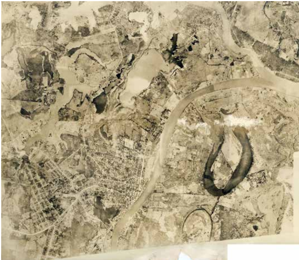
Imagen 3. Villahermosa y alrededores, 1931-1934