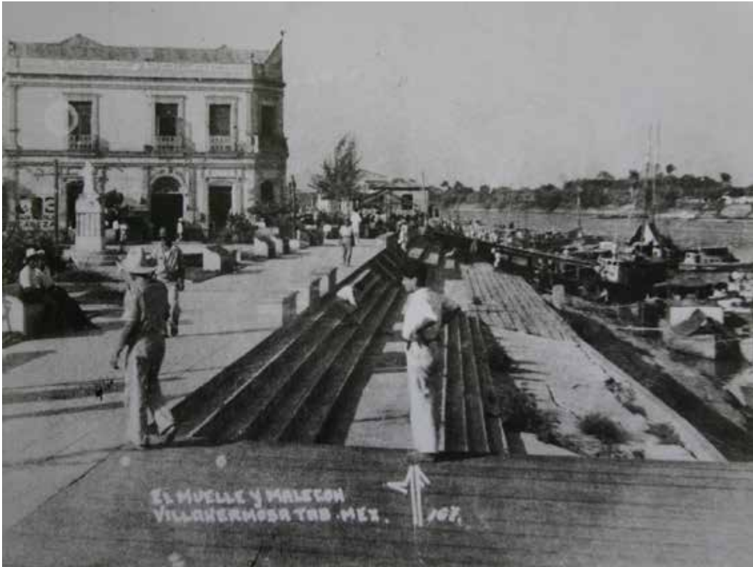
Imagen 9: Orillas del río Grijalva, entrada a la ciudad de San Juan Bautista (Villahermosa), s/f