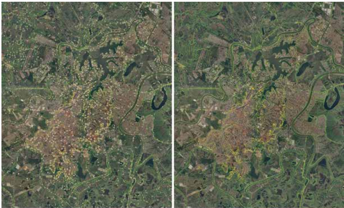
Curvas de elevación cada 2 metros