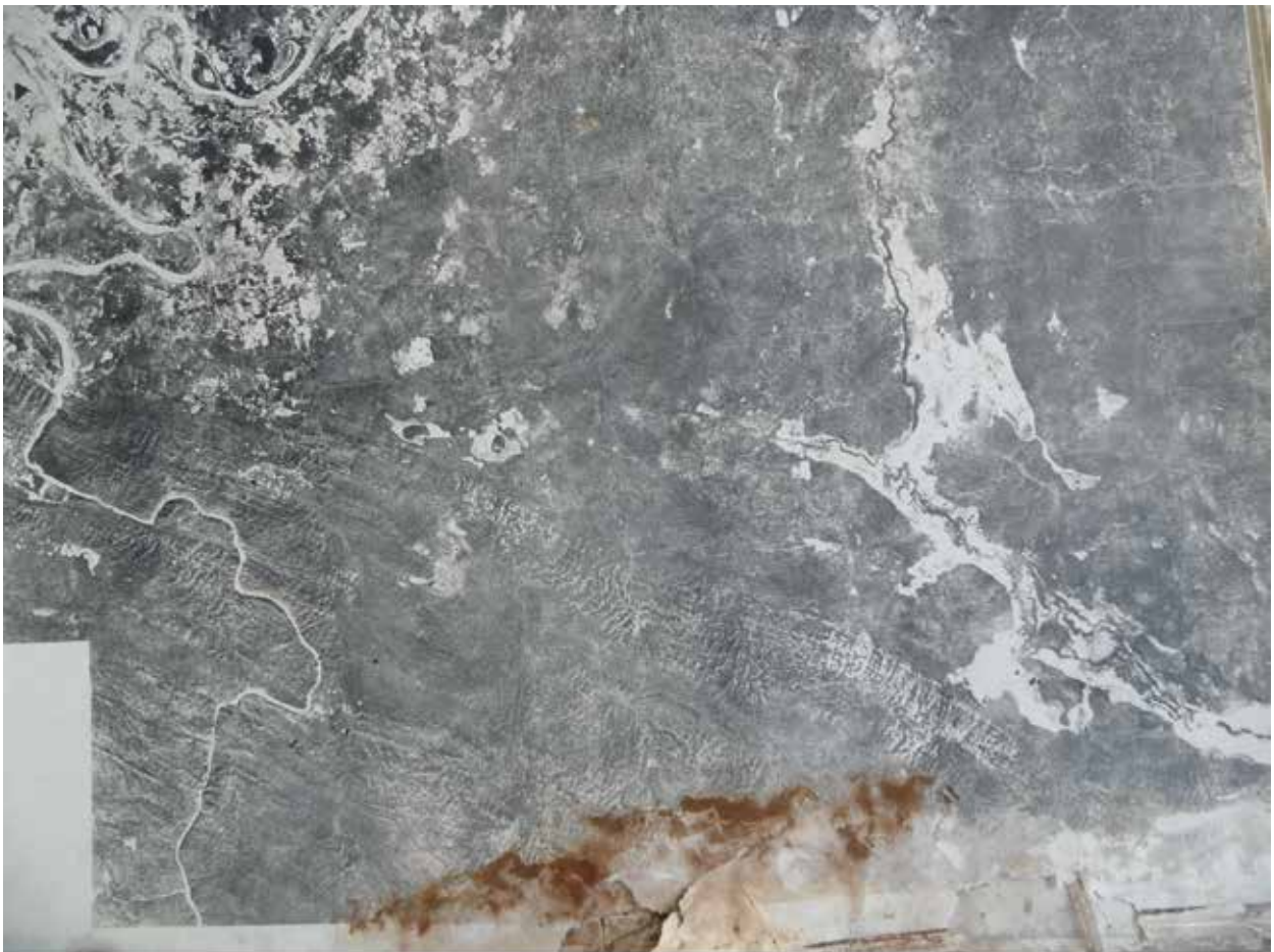
Imagen 1: Estado de una aerofoto sin tratamiento