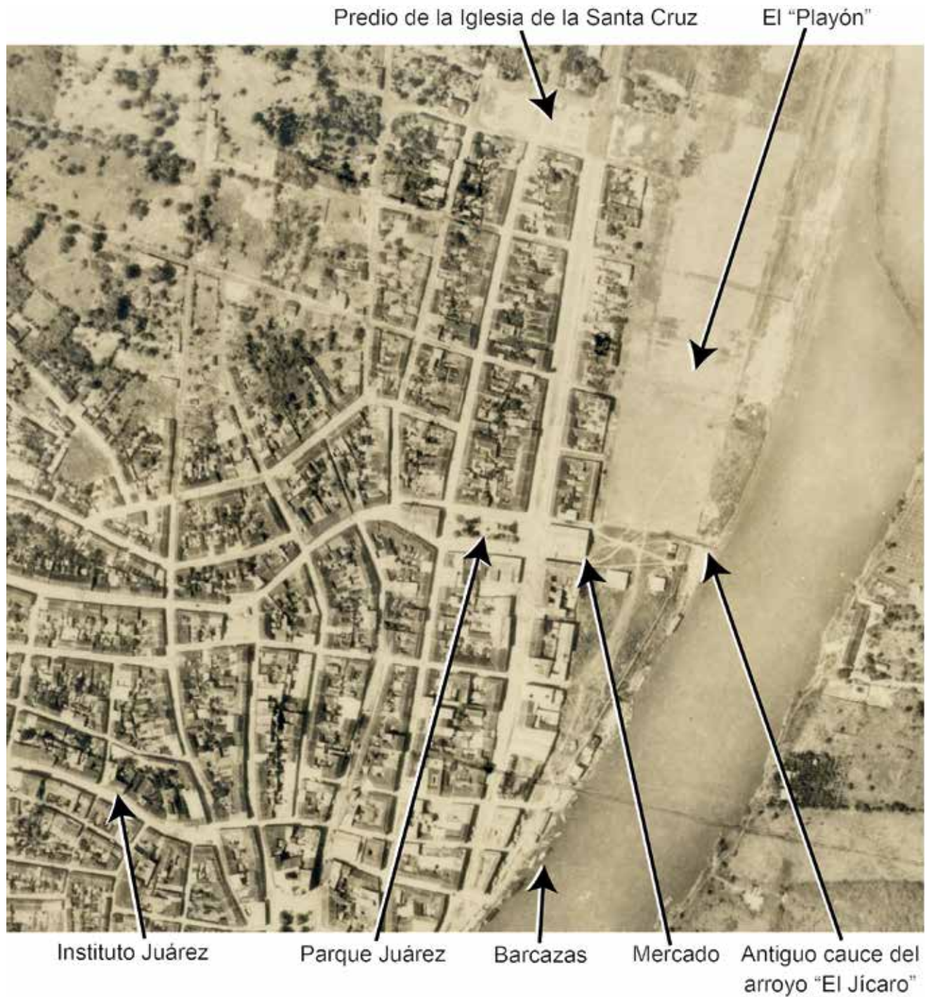
Imagen 7. Villahermosa y alrededores (detalle), 1931-1934

Fuente: Centro Documental de Estudios sobre el Agua, planero N° 4, Gaveta N° 3 del área de consulta.