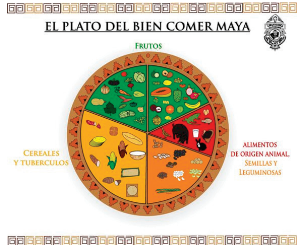
FIGURA 1. EL PLATO DEL BIEN COMER

* El estudio se realizó en Cholul, Yucatán, de enero a junio de 2015