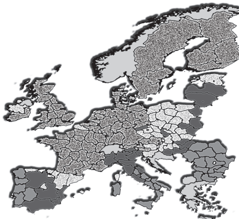
Gráfica 2 PERFIL DIGITAL DE LAS REGIONES EUROPEAS 13