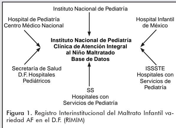
Figura 1. Registro Interinstitucional del Maltrato Infantil variedad AF en el D.F. (RIMIM)

En esta modalidad se debe enfatizar la necesidad de difundir especialmente el Síndrome del Niño Sacudido (SNs). Esta es una forma grave, extrema y poco conocida de AF sobre todo en el ámbito de la medicina crítica pediátrica.