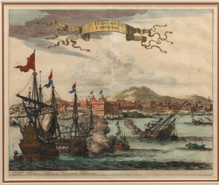
IMAGEN 1. PUERTO DE SAN FRANCISCO DE CAMPECHE EN EL SIGLO XVII, DE JOHN OGILBY

Cabe señalar que, en la factura del artículo, el análisis documental sobre los productos, mercaderías, mercaderes y comerciantes se sustentó en la pesquisa de la información contenida en los libros de Registros pertenecientes a la Casa de Contratación y Consulados, existentes en el Archivo General de Indias, Sevilla (AGI). Es necesario decir también que el ensayo se inscribe en la historiografía sobre el estudio del comercio en el Atlántico americano y, particularmente, en los distintos aportes que durante el orden colonial han estudiado el significado de la