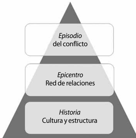
GRÁFICA 2. Modelo de análisis para la transformación del conflicto según Lederach (2009)

En la abundante bibliografía que ya existe sobre el movimiento comunal en Cherán, las distintas dimensiones del conflicto han sido abordadas a profundidad, aunque generalmente por separado, sin que el conflicto sea considerado de manera integral. La visión amplia que ha caracterizado mi investigación me permitió percibir una dimensión ulterior del conflicto, que engloba y determina las manifestaciones de la violencia expuestas anteriormente. El modelo elaborado por otro importante teórico de la Peace Research, Juan Pablo Lederach (2009), identifica esta dimensión como el epicentro del conflicto, esto es, la red de relaciones en la cual está enmarcado el conflicto mismo. A su vez, en el epicentro subyace la historia del conflicto, que consiste en el proceso histórico, cultural y estructural que favorece las relaciones conflictivas. Estas dos dimensiones integran conjuntamente la contradicción profunda, el conflicto-raíz que determina los episodios tangibles del conflicto en Cherán.