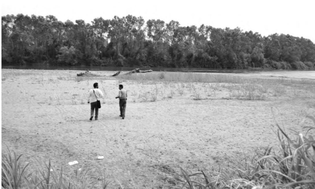
Figura 4. Fotografía de la ribera suchiatense en el ejido López Rayón dentro del caudal del río.

Sin embargo, esto no significa que la solución sea la existencia de terratenientes en la región. El éxito