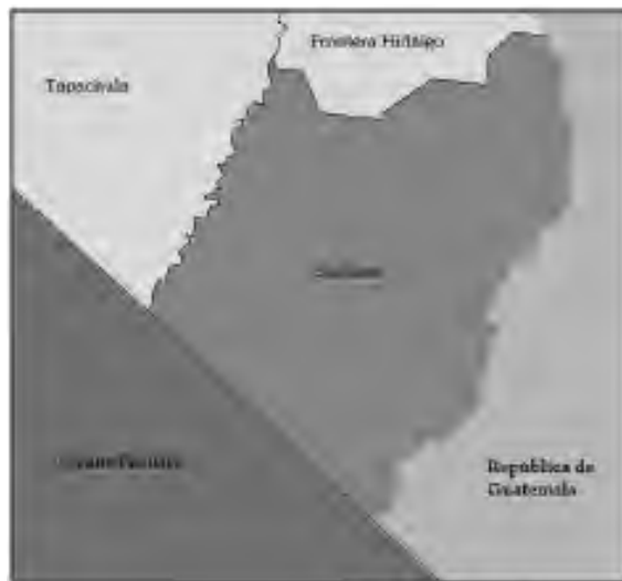
Figura 3. Extensión del municipio Suchiate. Adaptación propia.