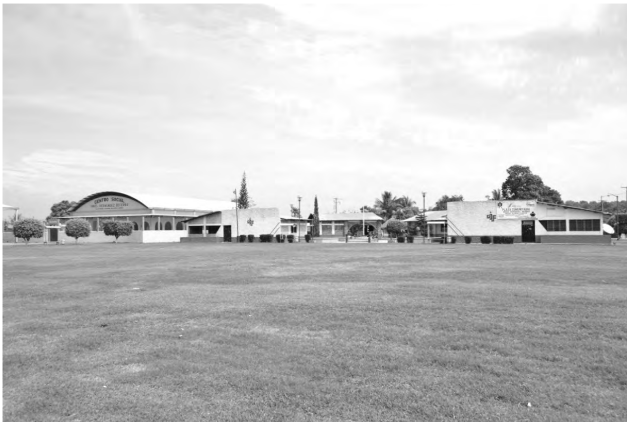
Figura 8. Explanada principal del centro del ejido Miguel Alemán.

respuestas de corte hidráulico ingenieril que se han utilizado para disminuir las consecuencias de los desastres que se pueden originar ahí, así como las dinámicas ejidales que han potenciado el conflicto.