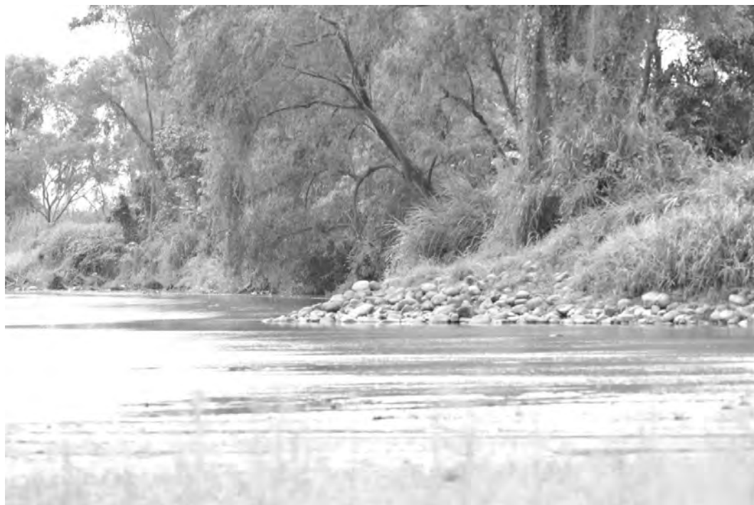
Figura 5. Fotografía de un espigón sin mantenimiento del ejido Ignacio López Rayón.

En el transcurso del recorrido y hasta su término, por la ribera suchiatense del ejido López Rayón, se puede comentar que esta ribera es la primera que debería presentar trabajos para su rescate natural e incluir un trabajo desde el aspecto ambiental. Es una ribera erosionada pero no seca. Se puede plantear este rescate en favor natural de la ribera pero ante esta solución surge el interrogante respecto del hipotético beneficio económico que trae a la población..