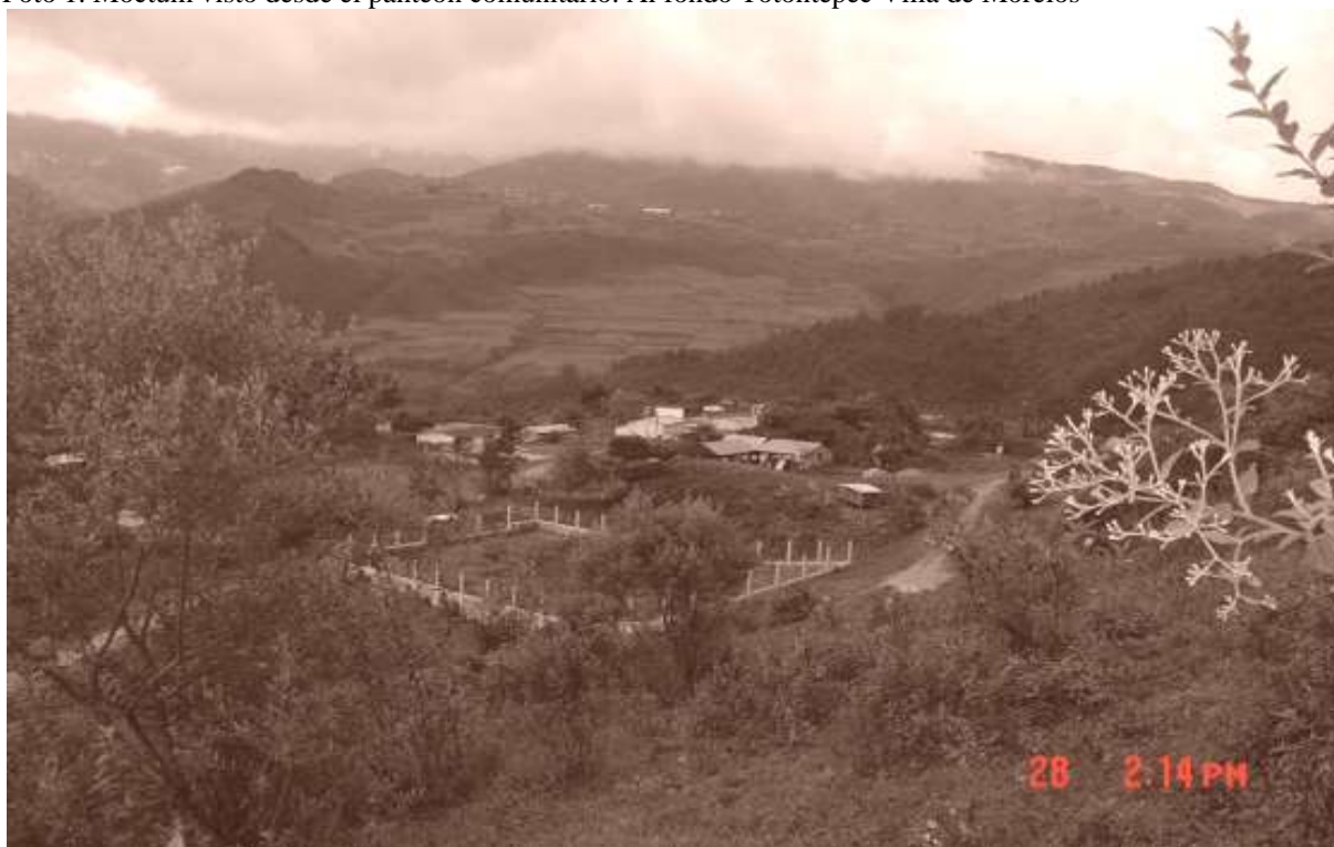
Foto 1. Móctum visto desde el panteón comunitario. Al fondo Totontepec Villa de Morelos

las autoridades indígenas y del colectivo comunitario sobre el individuo; sin embargo, no se puede afirmar esto de manera categórica y generalizada sin hacer un conocimiento y estudio profundo de los casos —sus circunstancias y usos del poder que los enmarcan— así como el contexto comunitario en el que se dan y con los que se pretende ejemplificar y respaldar tal afirmación.