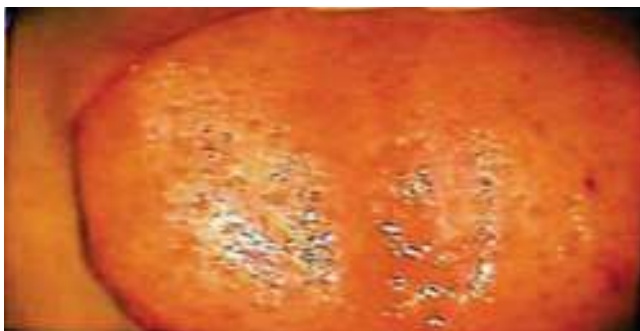
Figura 2. Fotografía de la lengua bajo visión colposcópica 15 días después de la cirugía.