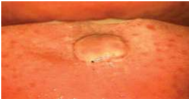
Figura 1. Inspección de la cavidad oral directa bajo visión colposcópica (Hinselmann, 2014), con aumento de 0.66x. Lesión de 1 cm de diámetro, color rosa, circular, de bordes mellados, sin pedículo y avascular.

El tratamiento se individualiza en cada caso. Pueden emplearse técnicas destructivas como la crioterapia o la electrocirugía, inmunomoduladores (imiquimod al 0.5%), o un antimetabolito que interfiera con la síntesis del DNA y el RNA (ácido ribonucleico) por inhibición de la timidilato sintetasa (5-fluorouracilo). 17,18