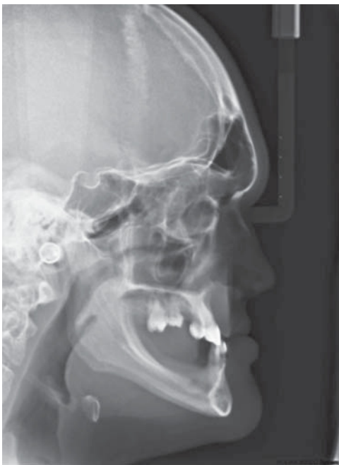
Figura 2. Radiografía lateral mostrando ausencia del proceso alveolar en regiones edéntulas de maxila y mandíbula.

El paciente fue sometido a documentación radiográfica inicial, obteniéndose radiografías panorámicas,