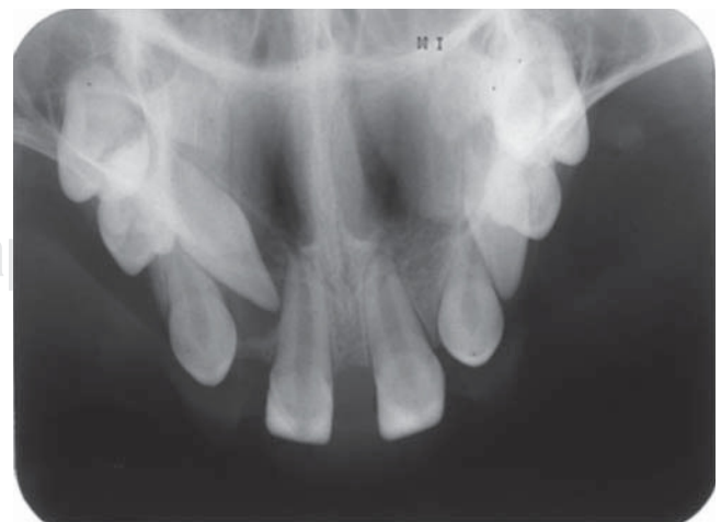
Figura 3. Radiografía oclusal de maxila que muestra la disposición de piezas dentarias presentes dentro del arco.

A partir del segundo año de vida y en edad más avanzada, el diagnóstico de pacientes portadores de esta alteración se hace más fácil, siendo los profesionales más requeridos los cirujanos dentistas, como el caso clínico que reportamos, debido a las ausencias