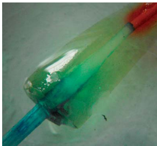
Figura 1. Endoposte del sistema RelyX (3M ESPE dental products), la cual muestra microfiltración a través de la interface endoposte-dentina.